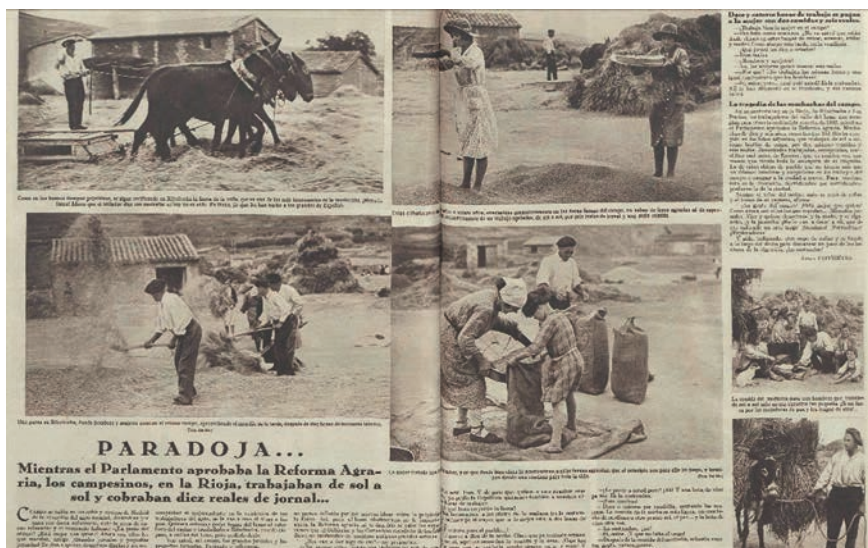
Crónica, nº 150. 25 de septiembre de 1932

solar de la Sierra de Cameros y una imagen de la Romería a la cueva de Santo Domingo de Silos en Laguna de Cameros.