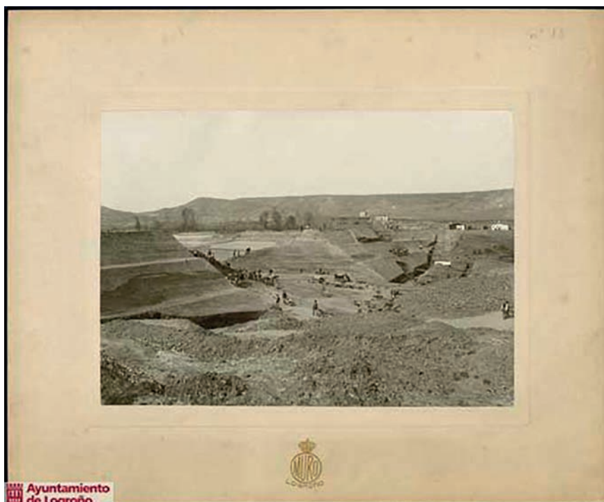
Alberto Muro: Obras de construcción del pantano de La Grajera. Archivo Ayuntamiento de Logroño

que aparece en la abertura entre ellas y que transcurre hacia la parte baja de la imagen. Como en muchas fotos de paisaje serrano, es significativa la variación de la vegetación tras las diferentes repoblaciones forestales del siglo XX.