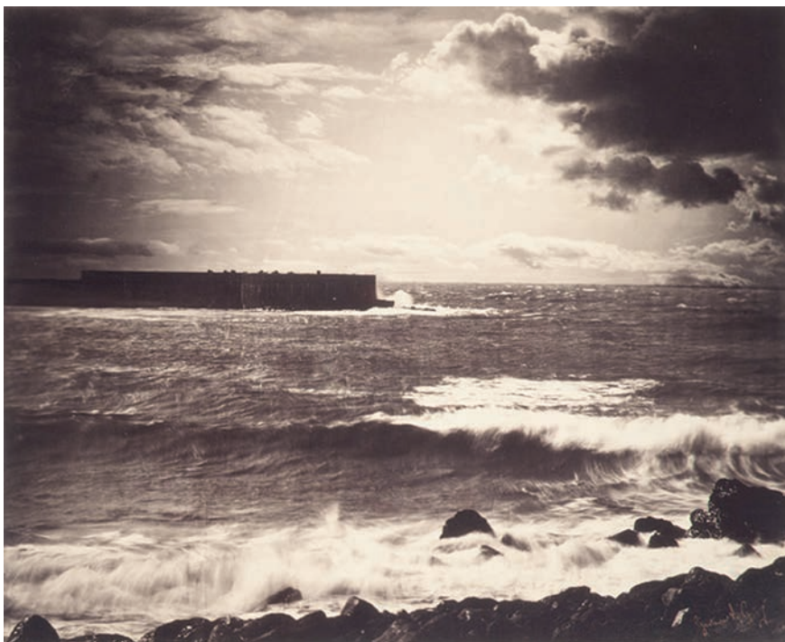
Gustave Le Gray. La grand vague. Sète, 1856