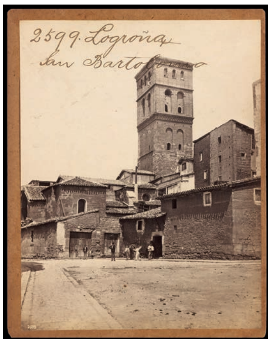
Francis Frith (Editor), Robert P. Napper (Fotógrafo) ca.1863. © Victoria and Albert Museum, London

Las fotografías que toma de la iglesia de San Bartolomé son sin duda diferentes pues no buscan tanto representar la ciudad sino uno de sus monumentos. En la que realiza del pórtico gótico del siglo XIV elige un punto de vista demasiado cercano, con luz solar directa que deja ver una intensa sombra provocada por un tejado próximo. El encuadre se limita a la puerta y de las diecinueve escenas que flanquean la puerta sólo se aprecian once. Mucho más interesante es la toma realizada a ras de suelo hacia la plaza y torre de San Bartolomé: la torre se impone por encima de diversas construcciones anejas de regular calidad, sin relación clara con el propio templo, de las que puede verse con precisión su fábrica de piedra o ladrillo y las cubiertas de teja. En la plaza se percibe el trazado del pavimento apropiado para caballerías y una zona central en la plaza sin pavimentar. Un grupo de niños, conscientes del fotógrafo, miran hacia la cámara.