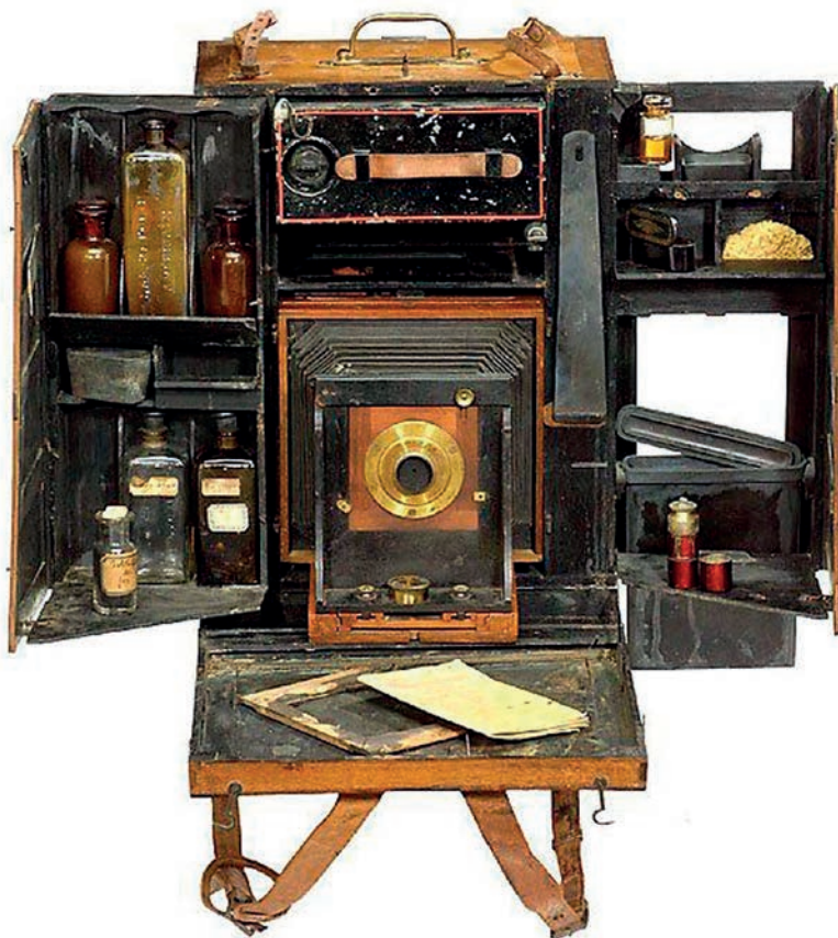
Laboratorio de viaje "Jonte", de J. Domenech (Inventor) y Jonte (Fabricante). 1869. Cámara para placas de colodión húmedo de 13 x 18 cm.

x 60 cm. A partir del negativo, por contacto directo con una hoja de papel sensibilizada y mediante la exposición a la luz solar en un marco de madera, se obtenía una copia de la toma inicial.