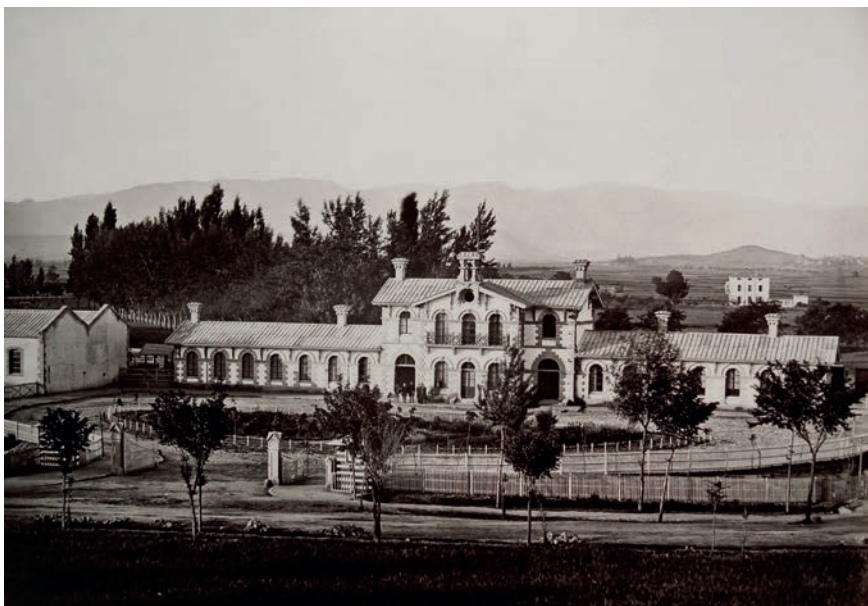
J. Laurent (1865)

En cuanto a las imágenes ferroviarias de la ciudad de Logroño, Laurent firma dos vistas de la estación. Una de ellas está tomada desde la ciudad hacia el sur y muestra el edificio de la estación. Recordemos que el trazado de la vía ocupaba la actual Gran Vía y que la estación se encontraba situada en los terrenos que ocupa actualmente la denominada Torre de Logroño. Tras el edificio vemos dos vías de la antigua trama de caminos que darían lugar a algunas calles de Logroño: en el ángulo sureste de la estación nace un camino arbolado en diagonal que el plano de Francisco de Coello de 1850 indica “Se une al camino de Lardero” y que corresponde a la actual calle de San Antón. Se aprecia además como esta vía confluye con otro camino arbolado que toma la dirección sur, la actual calle del General Vara de Rey y que vuelve aparecer alejándose hasta el propio Lardero que aparece difuminado en la imagen aunque es perfectamente apreciable una zona arbolada al lado de la carretera de Soria, la colina en la que se asienta el barrio de las bodegas y la iglesia del pueblo.