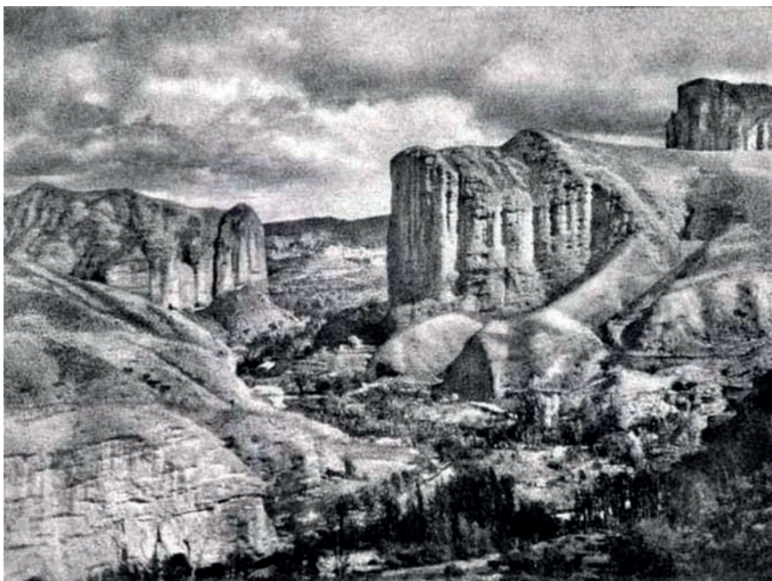
José Ortiz Echagüe (1886-1980): El Iregua Rioja 1. ca. 1935

gráfico. Como rechazo a la vulgarización de las imágenes que resulta de esta popularización de la fotografía, grupos de aficionados procedentes de la burguesía tratan de desarrollar una estética fotográfica personal y de situar el acto artístico en el corazón de la práctica de la fotografía. El pictorialismo recupera los encuadres del paisaje pintado tradicional y utiliza efectos pictóricos mediante diversas técnicas tanto en la realización de las fotografías como en los procesos de producción e impresión de la copia.