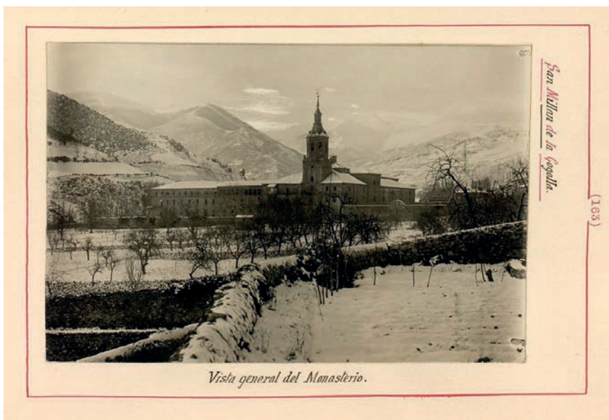
Marcos de Oñate. Catálogo monumental y artístico de la provincia de Logroño. ca. 1915

Similar el reportaje de Estampa publicado el 3-9-1932 sobre el cultivo y la industria del pimiento, con fotografías de Benítez Casaux y Tutor pero en el valle el optimismo es mucho mayor y la imagen que ofrece es mucho más positiva.