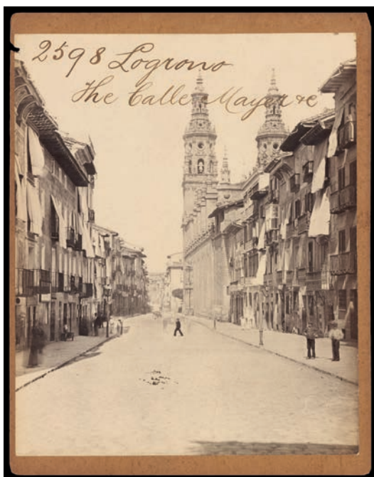
Francis Frith (Editor), Robert P. Napper (Fotógrafo) ca.1863.