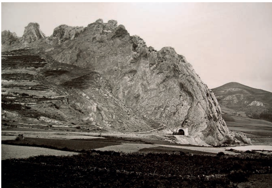
J. Laurent: Las conchas de Haro (1865)

alavés de Lapuebla de Labarca del que obtiene una fotografía por su singularidad geográfica, asentado en la falda sur de un cerro sobre una zona escarpada, prácticamente colgado sobre el río Ebro. Al pie del río aparece un viñedo.