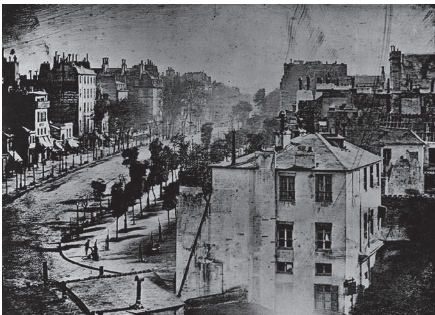
Louis-Jacques-Mandé Daguerre, Vue du Boulevard du Temple, Paris, 1839