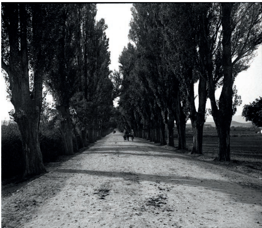
Carretera. ca. 1914-1919

Son decenas los editores de postales que trabajaron en La Rioja distribuyendo postales de todos los rincones de la geografía riojana y, desde luego, tanto la capital, Logroño, como las principales localidades como Haro, Calahorra, Santo Domingo, Nájera, Alfaro o Arnedo y lugares monumentales como San Millán de la Cogolla formaban parte de las colecciones de las grandes editoras y distribuidoras nacionales.