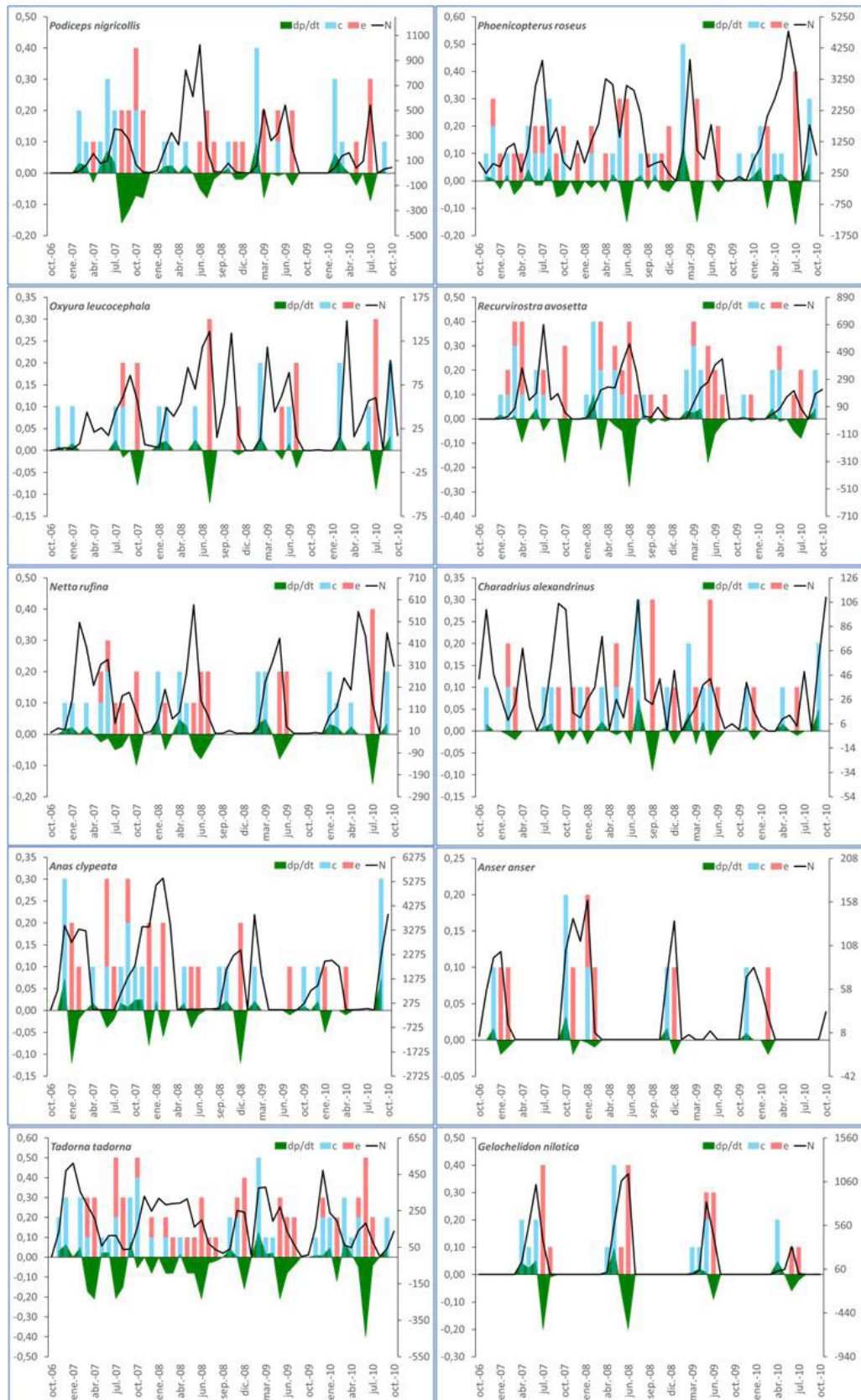
Gráfico 2. Variación mensual entre 2006 y 2010 de la proporción de sitios ocupados ( dp/dt ), las tasas de colonización ( c ) y extinción ( e ) – representados en el eje de la izquierda de las gráficas, y del número total de individuos censados ( N ) de las especies censadas – eje de la derecha en cada gráfica.