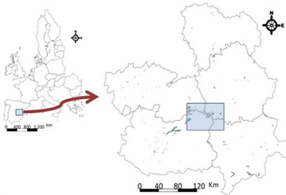
Mapa 1: Localización del área de estudio