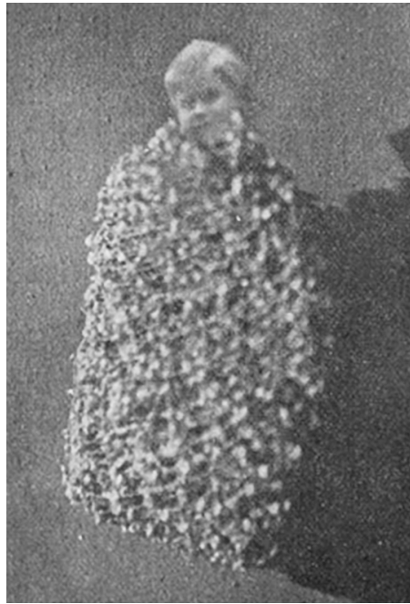
F6. Fotografía de niño no identificado (22 de octubre de 1913).

Camino facilita algunos de los datos que Blanco había ya publicado. Por otra parte, asegura conocer buena parte de la bibliografía espiritista y añade que esas fotografías constituyen testimonios materiales de la aparición de espíritus valorando su procedencia española “pues hasta la fecha sólo se habían obtenido fotografías de esta clase en el extranjero” (Camino Galicia, 1919, p. 87).