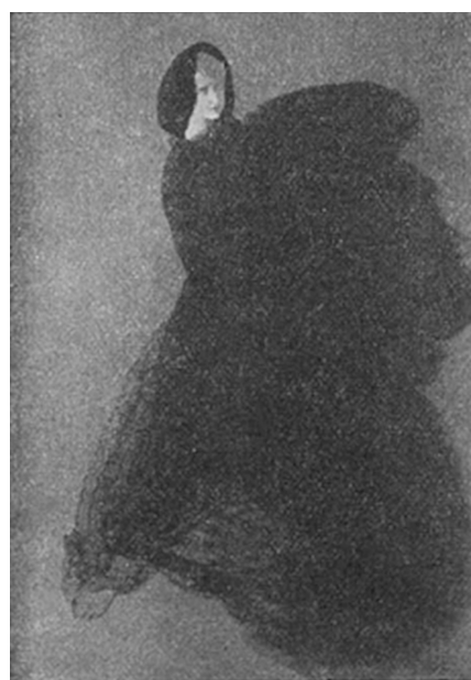
F5. Fotografía de Lolita la Castañera (22 de octubre de 1913).