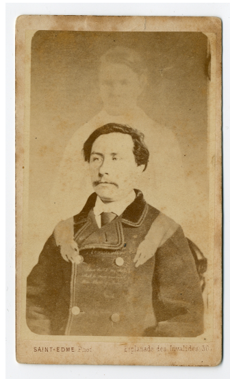
F1. Retrato de un hombre y un espíritu del fotógrafo Saint Edme. N° de registro MFM-S-21984

Buguet antes de que Leymarie se decidiera a bendecir su producción espiritista (Chéroux, 2005). En abril de 1875, cuando la policía registro su domicilio, encontró 40 fotografías espiritistas (Lestang, 2017). Alguna carte-de-visite de Saint Edme llegó a España. En concreto en el Museu Frederic Marès de Barcelona se conserva una de ellas (F1) procedente de álbumes familiares de la Ciudad Condal, sin que se conozcan más detalles.