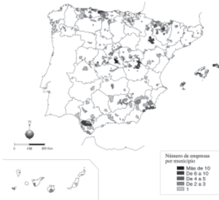
Mapa 1. Distribución municipal de las empresas de turismo activo (año 2001)

Fuente: Guía de Turismo Activo 2001 ( www.tourspain.es ). Elaboración: Antonio J. Lacosta Aragüés.