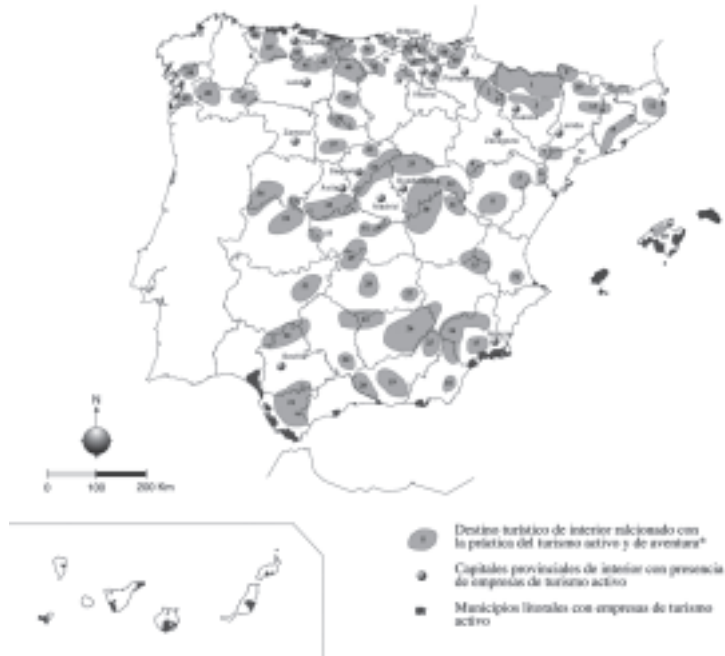
Mapa 2. Los destinos relacionados con la práctica del turismo activo y de aventura (año 2001)

* Clave identificatoria de los destinos turísticos de interior en el cuadro n.º 3.