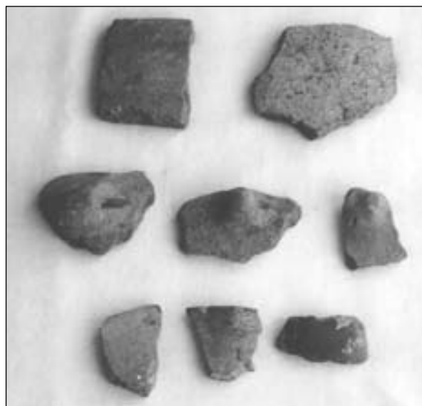
Figura 2.- Restos cerámicos del poblado de Quel.