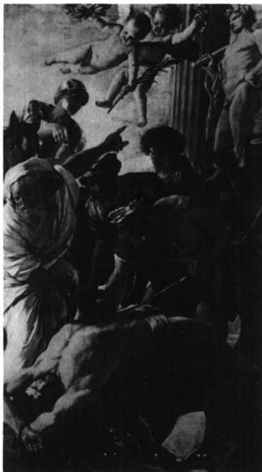
Fig. 4. Nicolás Poussín. Martirio de San Erasmo (1630).