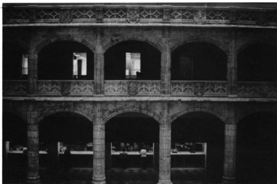
Fig. 1. Burgos: casa del Cordón.

esta casa burgalesa está relacionada con la arquitectura alemana, por ejemplo en la suerte de «pilastras» (naturalmente nada «antiquizantes») del lado frontal de los pilares del patio, que siguen el mismo principio de los de la (desaparecida) casa Winklerstrasse 5 de Nuremberg (1496); también la tracería de «vejigas de pez» colindantes de los antepechos es igual a la de los brazos del crucero de la catedral de Halberstadt, etcétera.