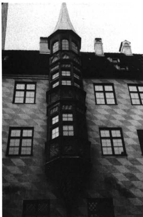
Fig. 5. Munich: «Alter Hof».

que recibió un tratamiento insólito en España: una trama fusada bicolor (ocre-blanco), en la que los romboides se extienden por toda la superficie.