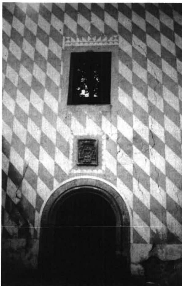
Fig. 4. Yuste: Monasterio, portada.

El gran patio de los Welser en Nuremberg (1509) es una de las aplicaciones más exquisitas de la tipología en cuestión. Su eco en el patio de las Comendadoras de Santa Cruz de Santiago en Valladolid se explica por ser obra mandada a construir por Carlos V 9 , quien por estos años (1524-1542) tenía arrendado el Maestrazgo de dicha orden a las familias Fugger y Welser 10 .