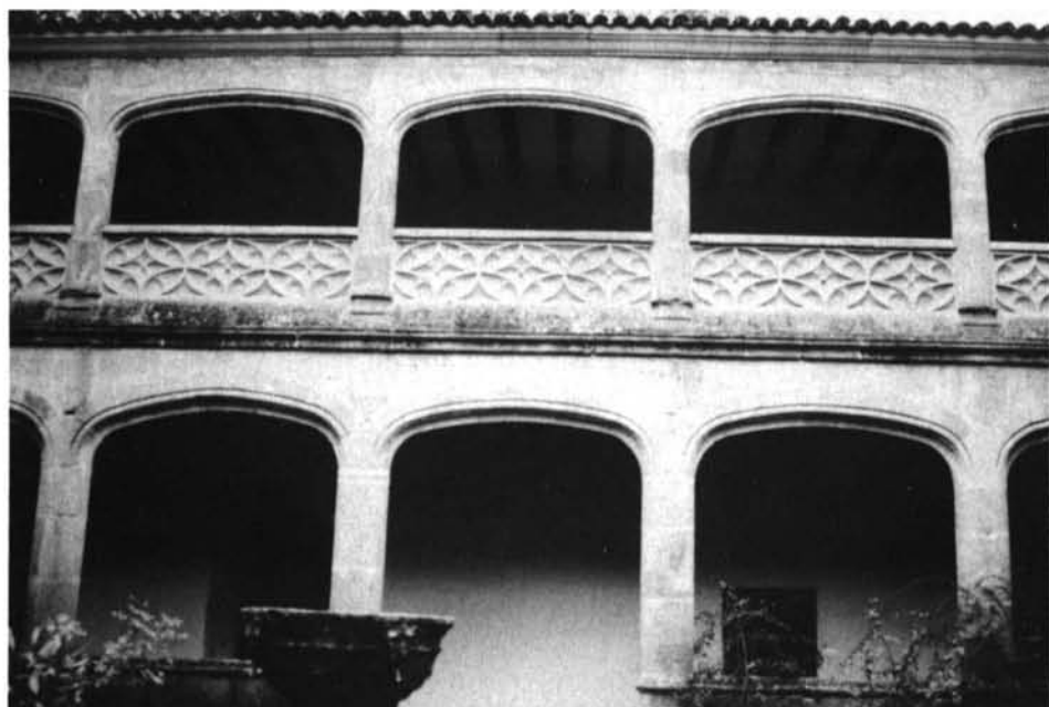
Fig. 3. Yuste; Claustro «Gótico».

en Extremadura su perfilado, el diseño de las basas es muy semejante, la falta de capiteles es compartida, los arcos rebajados son escarzanos en Burgos (como siempre en Alemania) pero carpaneles en Yuste y Plasencia.