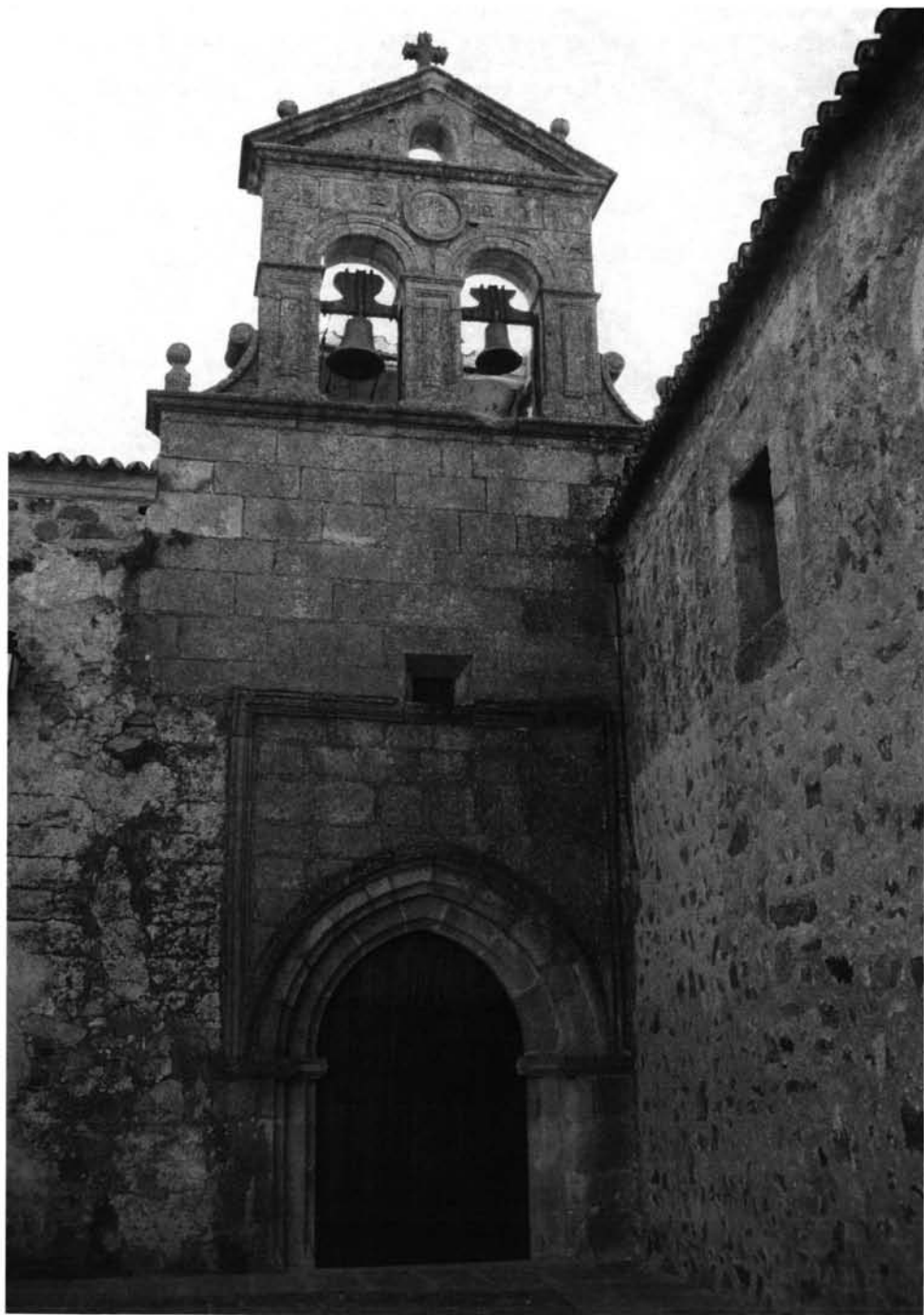
FIG. 3. Fachada de la iglesia conventual de San Pablo de Cáceres, junto a la parroquia de San Mateo.