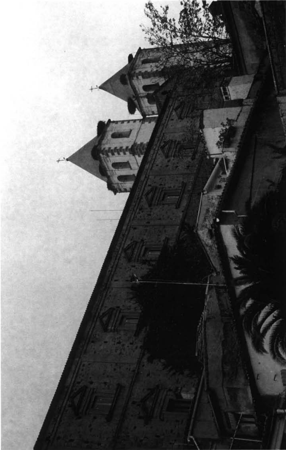
FIG. 6. Detalle del Colegio y de las torres de la Iglesia de la Compañía de Jesús de Cáceres.