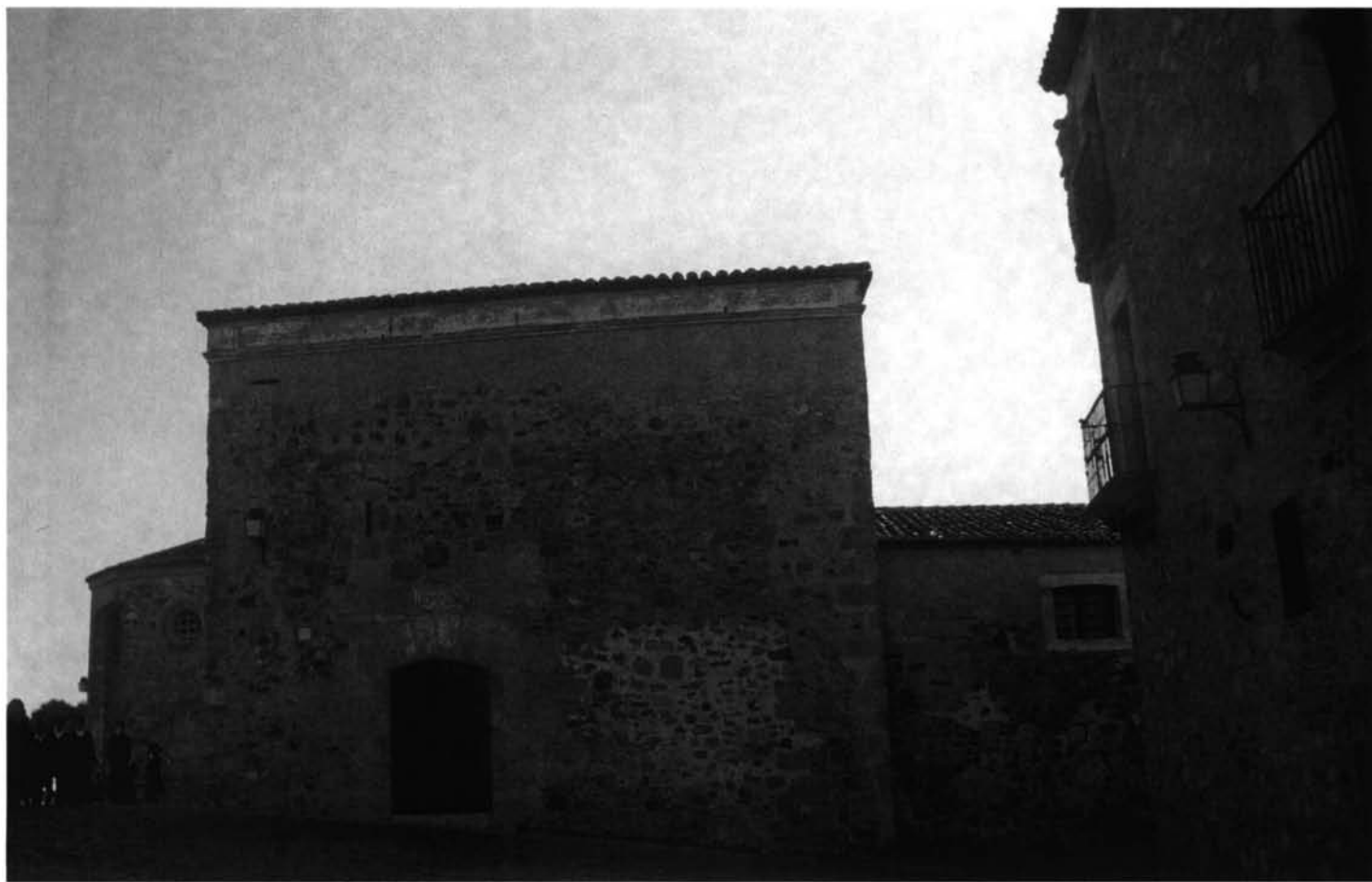
FIG. 4. Cuerpo de la portería del convento de San Pablo de Cáceres.