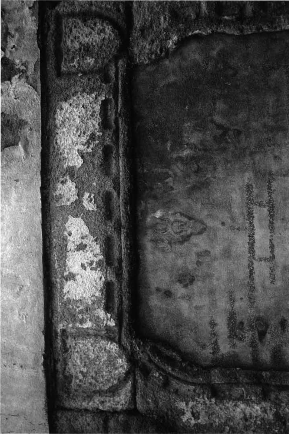
FIG. 2. Portada perteneciente al antiguo convento jerónimo de Santa María de Jesús, hoy Diputación Provincial.