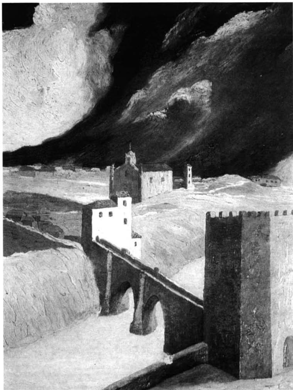
FIG. 4. Toledo, sin fecha . Óleo/cartón, 38,5 × 20,8 cm. Colección particular.