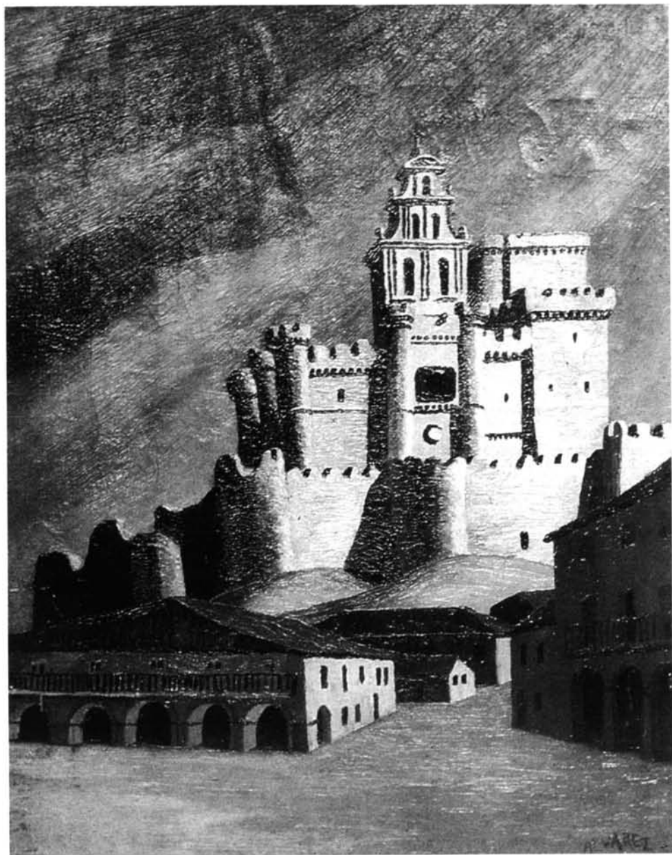
FIG. 2. Castelo de Turégano , sin fecha. Óleo/tela, 40,5 × 32 cm. Colección particular.