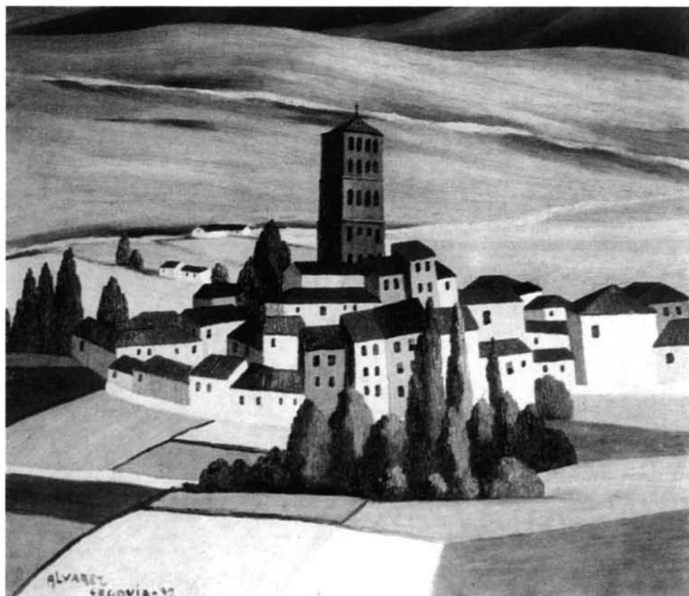
FIG. 3. Segovia , 1932. Óleo/tela, 56 × 66 cm. Colección Centro de Arte Moderno, Fundação Calouste Gubenkian, Lisboa.