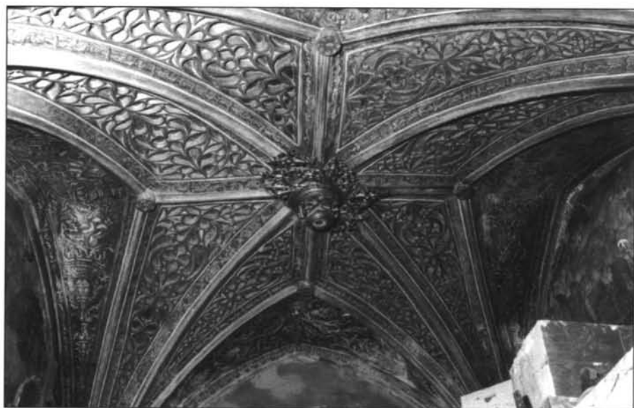
Claustro de San Francisco de Tarazona. Capillas de Nuestra Señora de la Piedad y del Sepulcro.