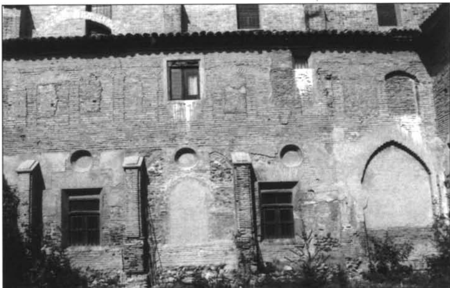
Claustro de San Francisco de Tarazona. Arcada del ángulo Sureste. Conjunto de la galería septentrional. (Foto Jesús A. Orte).