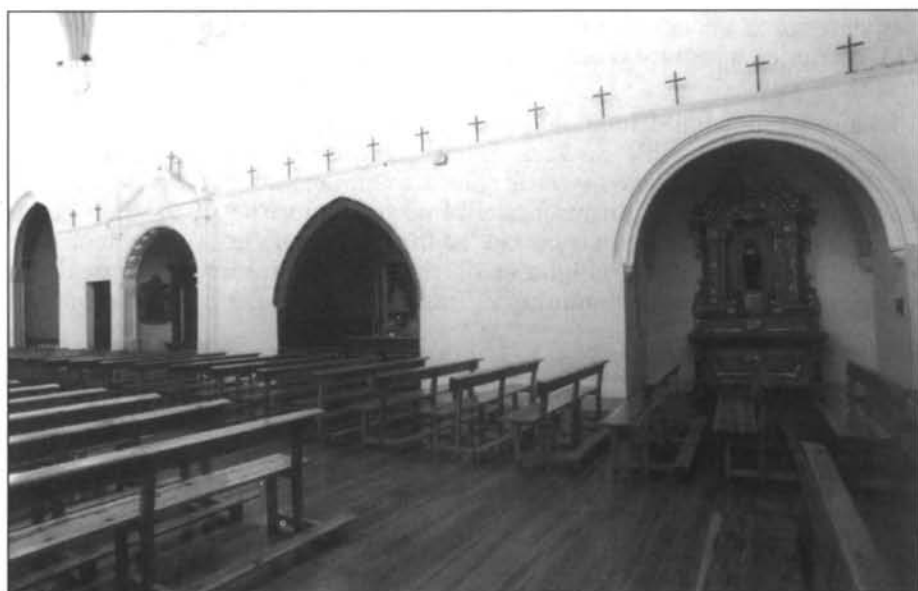
Iglesia de San Francisco de Tarazona. Puerta principal. Capillas del lado de la Epístola.