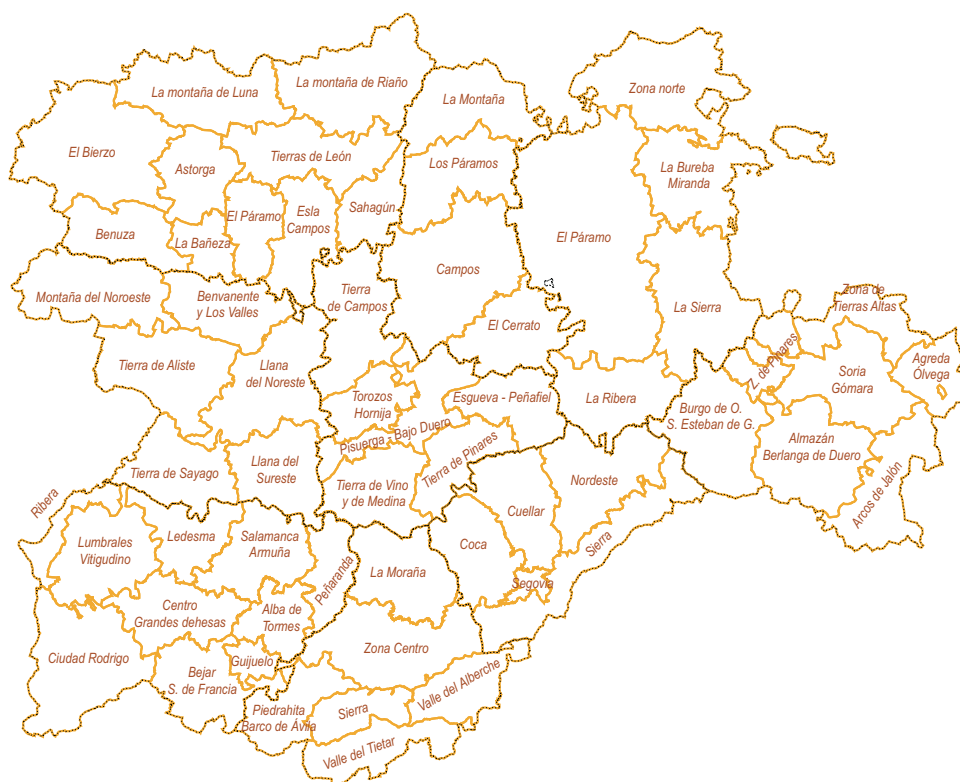
Fuente: Administración Institucional de Servicios Socio-profesionales. Servicio Nacional de Consejos Económico-sociales (1977): Comarcas españolas .

El objetivo, en cualquier caso, no ha sido la implantación generalizada de la comarca como entidad local, sino la definición de ámbitos para la ordenación del territorio. A modo de excepción y dando cumplimiento a las expectativas locales, en 1991 se creó la comarca de