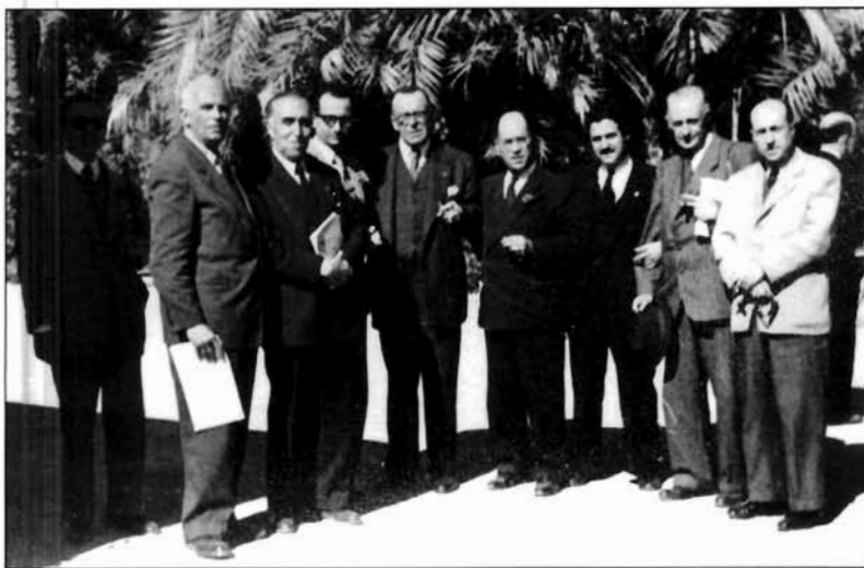
LÁMINA 4. IV Congreso de Arqueología del Sureste (Elche 1948).