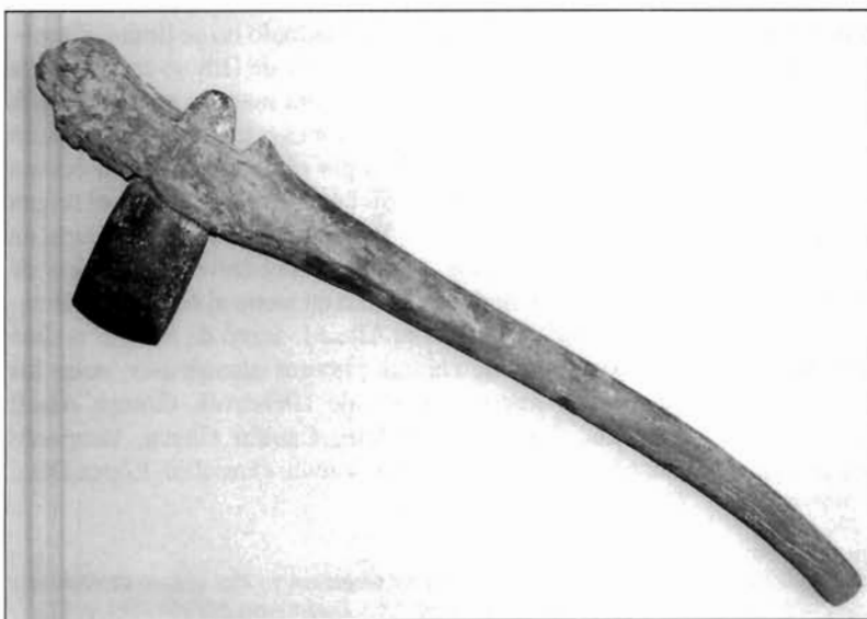
LÁMINA 5. Hacha enmangada de los Blanquizaes de Lébor (Museo Arqueológico de Almería).