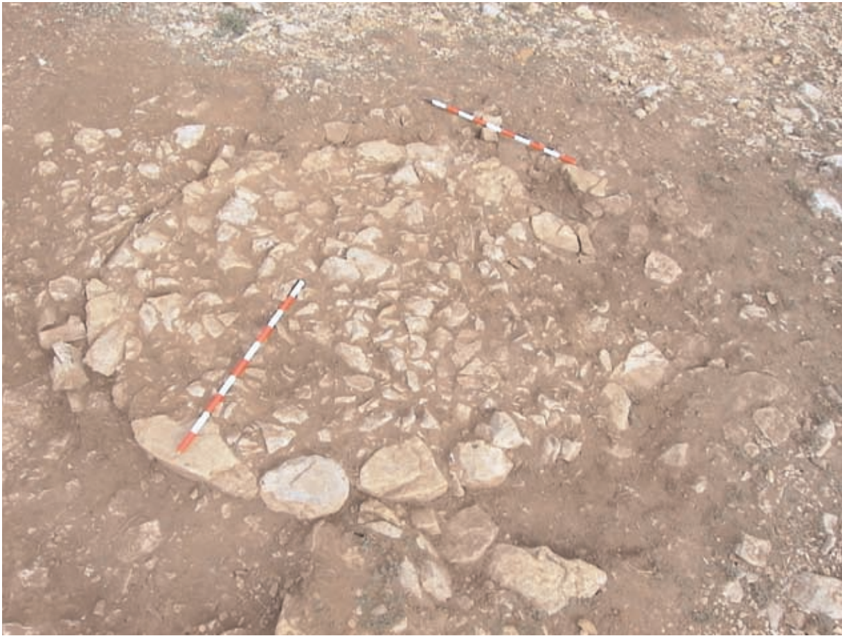
Figura 3. Tùmul 2000, amb la coberta de terra i pedres abans de començar l'excavació. A la dreta s'observa com el cercle pareix afectat per alguna remoció.

grisosa homogènia, amb algunes zones més negres. Són fragments molt menuts en la seva majoria. El fragment de major grandària correspon a la calota cranial i mesura 23 per 16 per 4 mil·límetres. El petit volum de les restes dificulta enormement la seva identificació.