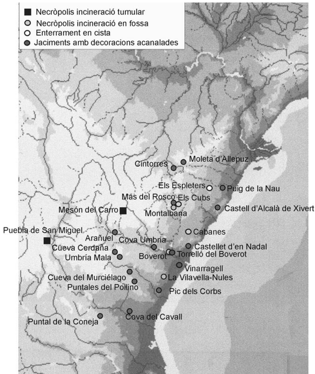
Figura 1. Mapa amb la ubicació de totes les necròpolis conegudes en les nostres terres.

La morfologia interna d'aquest túmul és diferent a les dues estructures descrites abans. La roca sobre la que es construeix aquest anell és molt irregular, pel que una meitat es troba més enfonsada que l'altra. És en la meitat més alta on vam trobar fragments ceràmics, que pertanyien a una mateixa peça. La part superior del túmul era pla, com els altres, i construïda amb terra i algunes pedres de dimensió mitjà-gran. L'estructura es troba ben conservada.