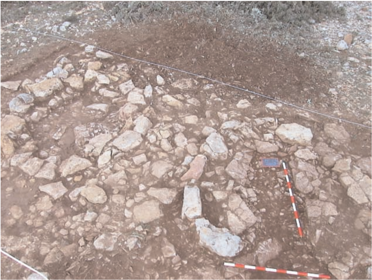
Figura 4. Túmul 4000 (esquerra) i 3000 (dreta). Aquest segon amb cista central.

que el dipòsit hauria estat sepultat en els seus orígens.