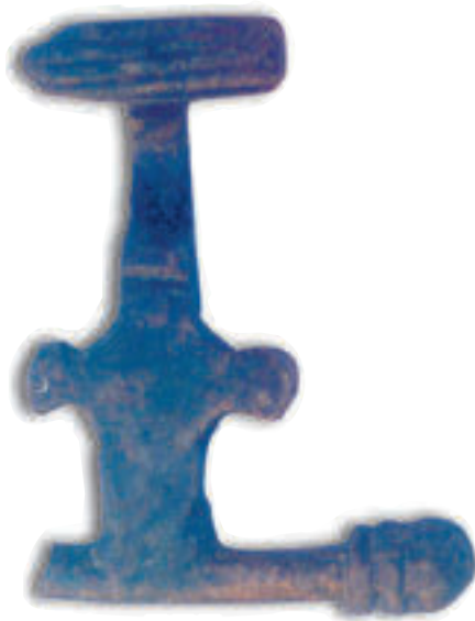
Después de la restauración: Reverso