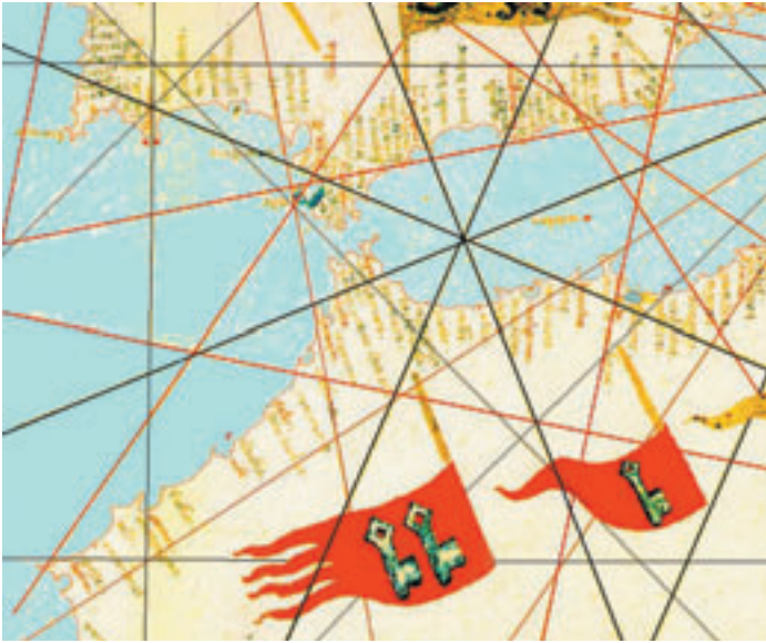
Portulano con las basderas de Melilla y Ceuta, de Francisco de Cesanis, año 1421, Museo Civico Correr de Venecia.

(+3,34 m) y lo más alto de la ciudad (+35.72 m), o frente de mar, en la Lengua de Sierpes (junto al museo militar).