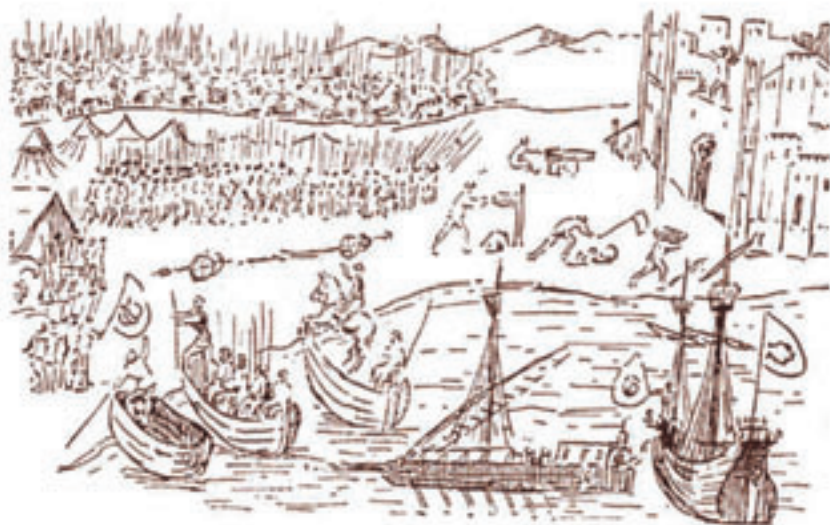
Ilustración de la casa de Niebla, año 1550, "Melilla 1497"

En el documento de Melilla se define la loma de la Alcazaba (p-23) por sus padrastrs o alturas: desde la cota más alta (en otros documentos altura del Cubo) con unos diecisiete metros, que es aproximadamente la diferencia (16,72 m) de la cota del Cubo con la del lugar (Villa Vieja) de donde se mide (+39,06 m = 22,34 m + 16,72 m), confirmado por la diferencia de cota entre el padrastrs