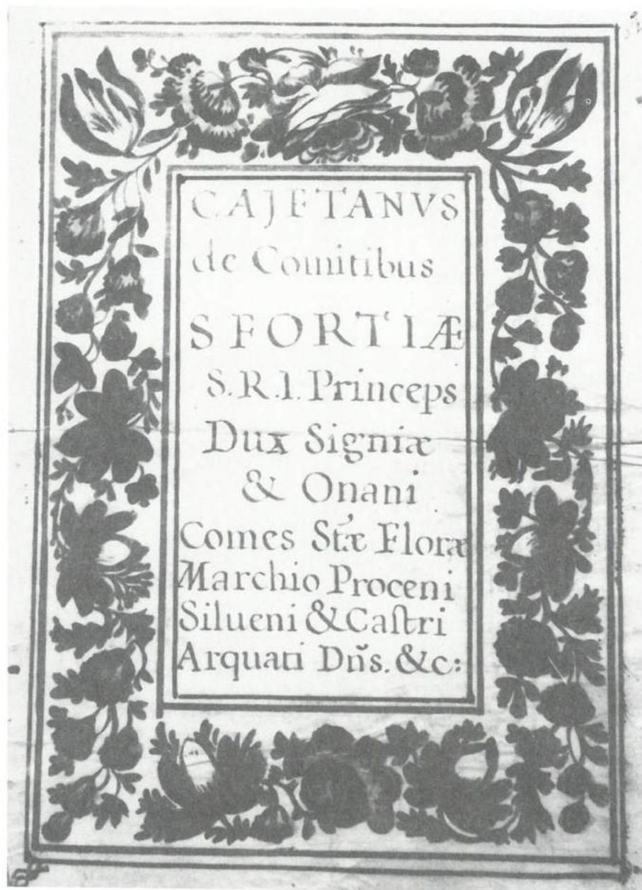
XV.—Archivo Histórico Diocesano. Jaén. Sala X, 7-2-2. Título de doctor en teología. Roma, 14 marzo, 1716.