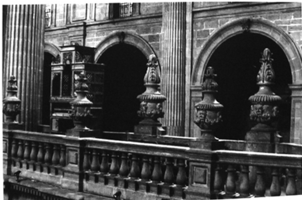
Realejo, conservado en la balaustrada del Coro de la Catedral.