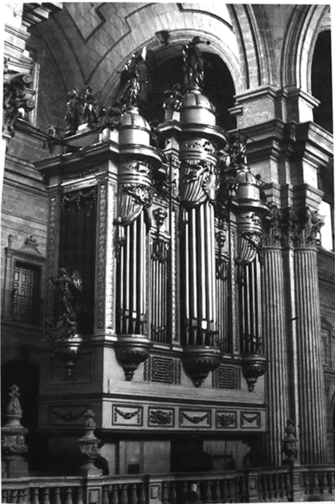
Órgano, en la actualidad.