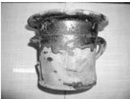
Calle Don Gonzalo, 2. Cerámica vidriada

En enero de 2003 el Área de Patrimonio del Ayuntamiento depositó en el museo una serie de materiales cerámicos encontrados por trabajadores de la empresa San Pancracio, al realizarse obras de ampliación en el patio del actual Ayuntamiento, en la calle Don Gonzalo, 2. En dicho lugar; en un pozo ciego aparecieron una serie de cerámicas vidriadas de época moderna.