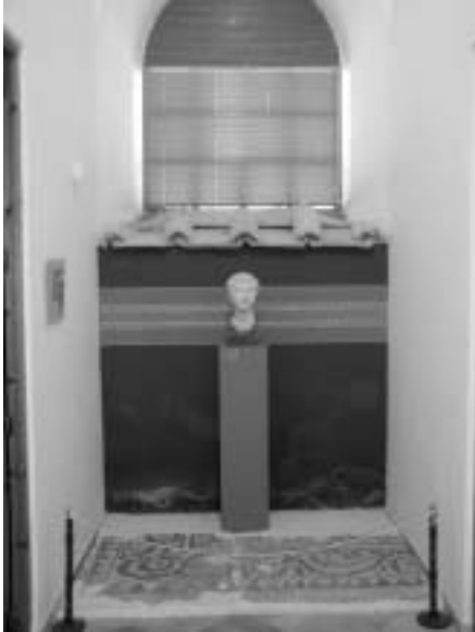
Escultura y mosaico romano

reducido grupo de visitantes procedentes de la U.E. (Francia, Inglaterra, Alemania).