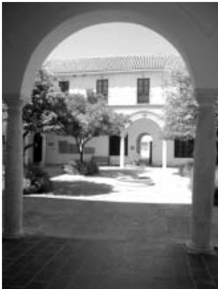
Museo de Puente Genil. Claustro del Convento La Victoria

En la sala III (Sección de Etnografía) continuando la labor iniciada en