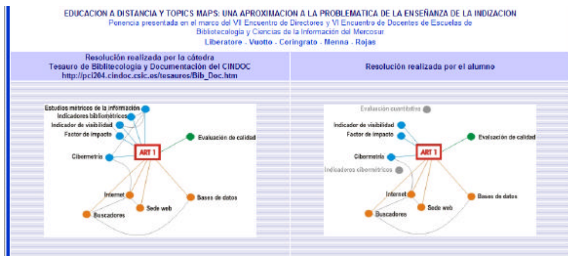
Imagen 2: pantalla donde se establece la comparación gráfica entre la indización aportada por la cátedra y la realizada por el alumno