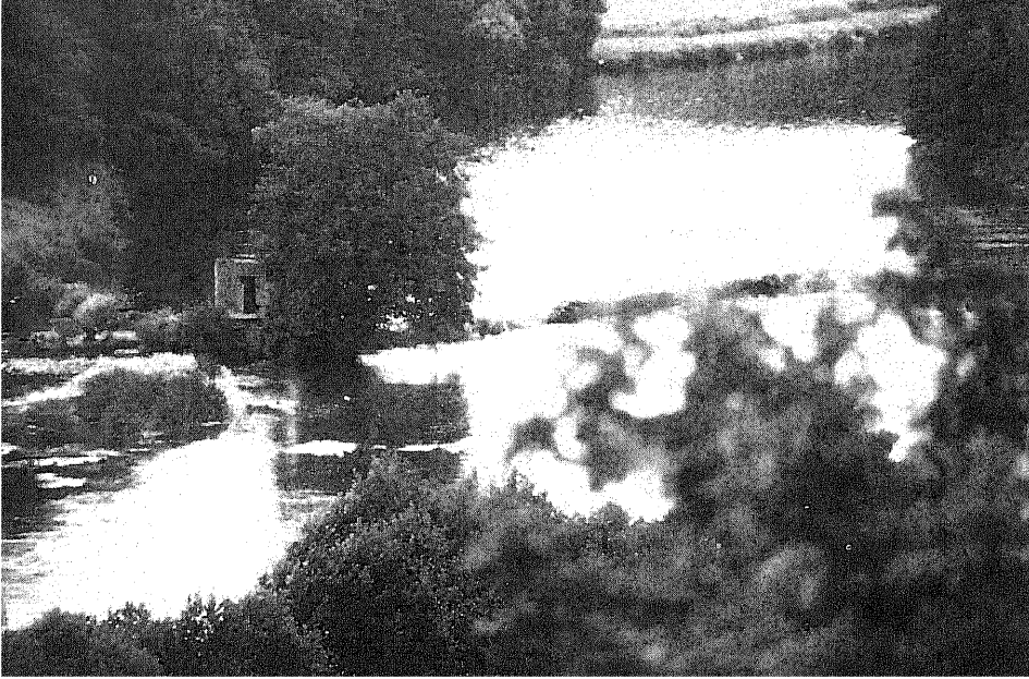
Los caneiros instalados en los ríos Miño y Chanca a su paso por las inmediaciones de la ciudad pertenecían al obispo. Caneiro de A Tolda