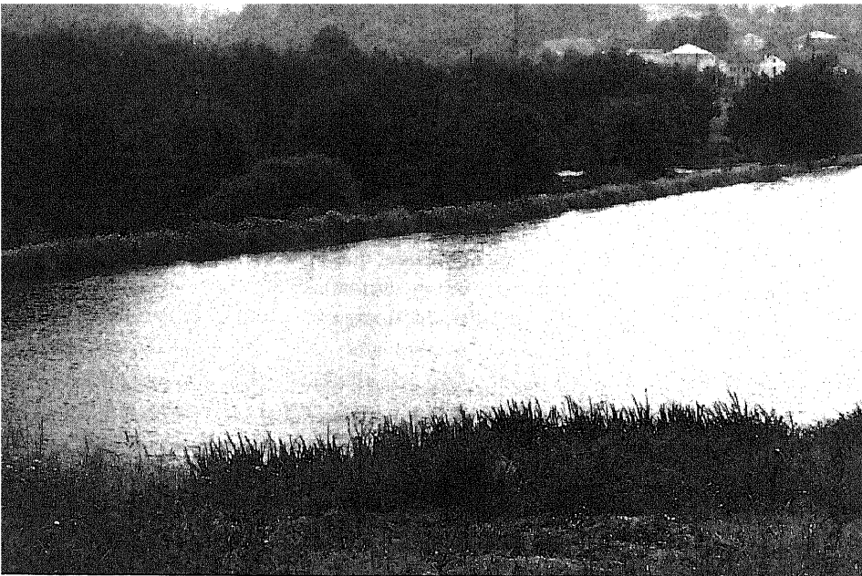
El río cotado del obispo comprendía desde el canal de San Lázaro hasta el de la aceña de Olga. Caneiro de San Lázaro.