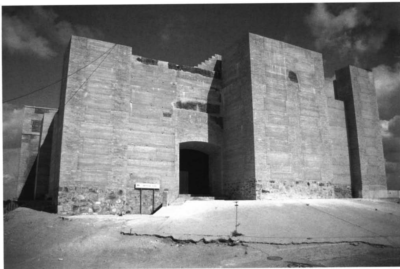
Cartaya. Castillo. Del primitivo recinto, actualmente, solo se conserva el circuito interior.