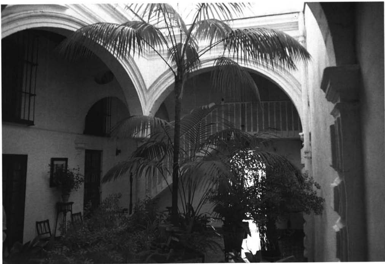
Vista actual del patio, desde la escalera de acceso a la planta noble.