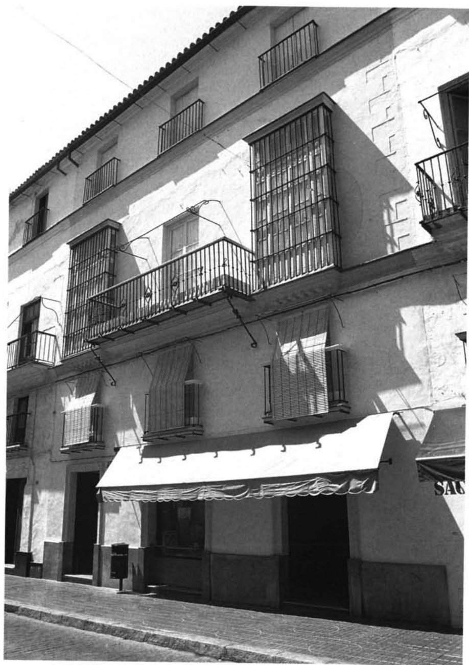
Vista actual de la fachada de la casa de los Rivas en la calle Luna.