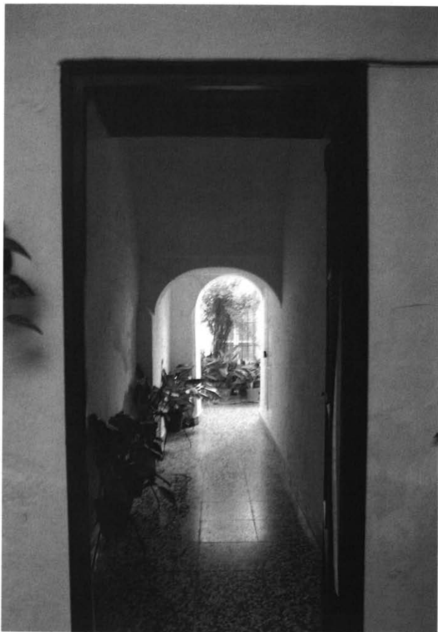
Vista actual del pasillo de comunicación con el patio posterior.