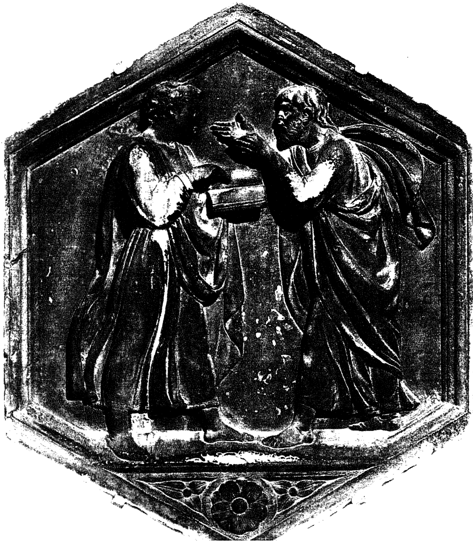
Platón e Aristóteles. A cultura do debate, da discusión dialogante para achega-las opinións diversas, debería presidir toda confrontación social. Forma y Color. El taller de los Della Robbia . Edit. Albaicin-Sadea.