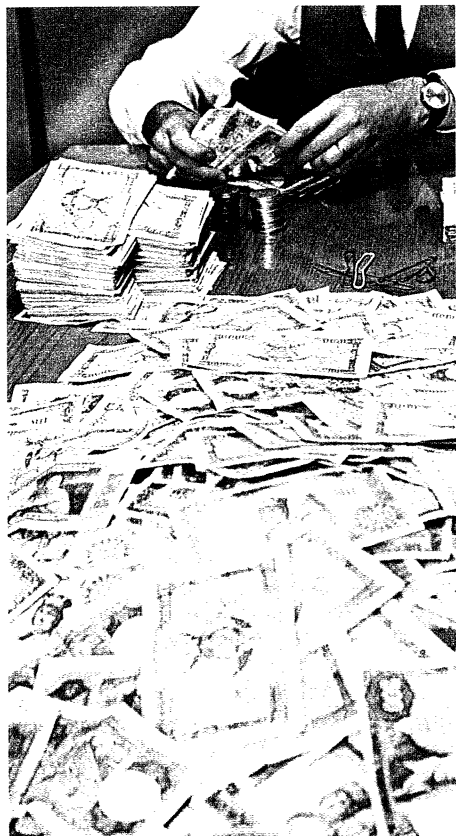
Universitas . Tomo 2. Edit. Salvat.

A vía do monetarismo consumista, acaparador de riqueza, leva como bandeira o aforismo "tanto tes, tanto vales".