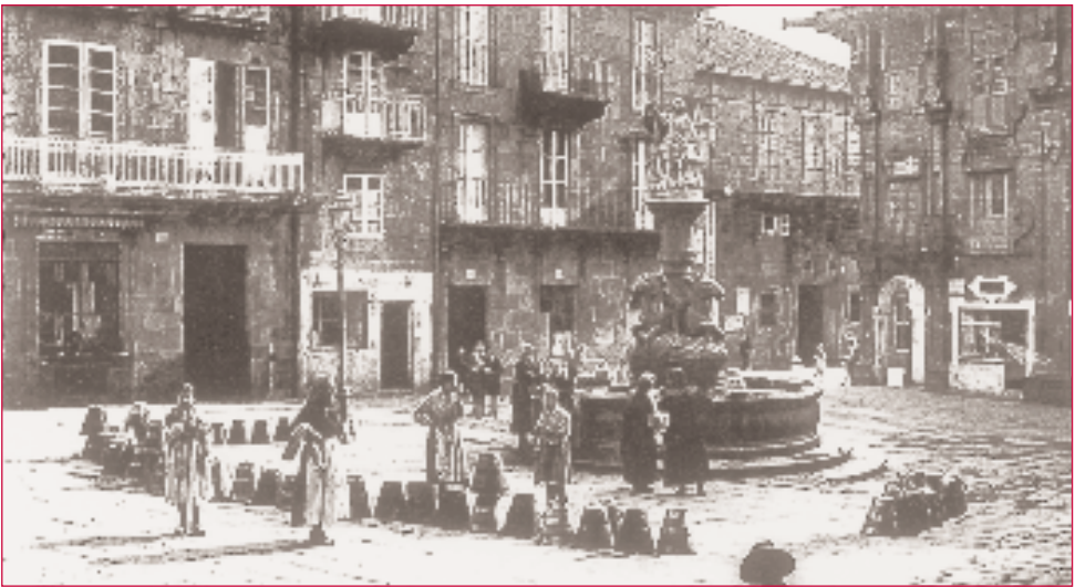
A praza da Platerias antes da construción do edificio do Banco de España. Collendo auga coas sellas.

Facemos comentarios e unha lectura gráfica do material exposto.