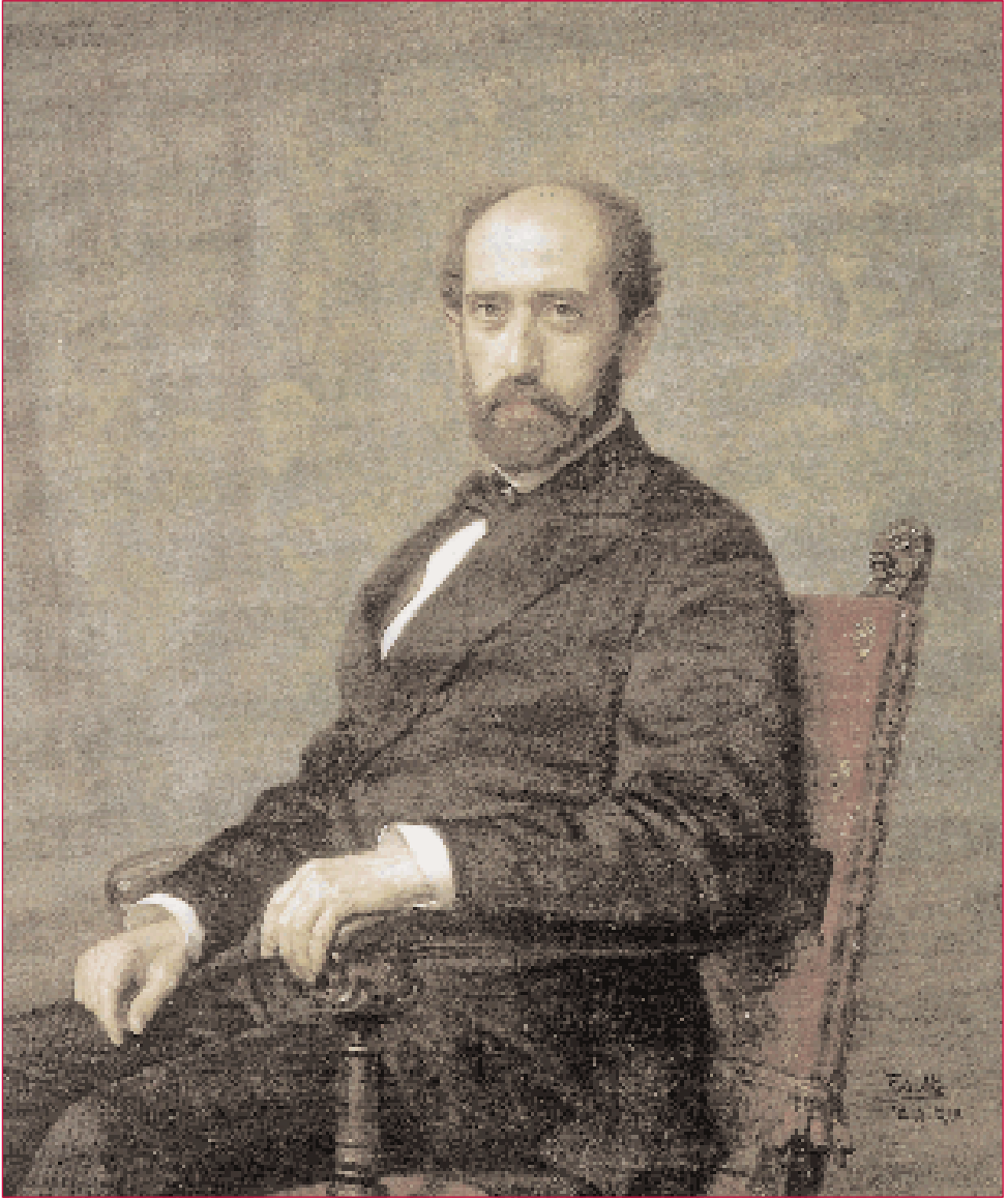
Nicolás Salmerón, por Federico de Madrazo.

[...] y que en la educación de todos se cumpla aquella finalidad sin la cual es imposible la integridad de la persona humana [...].