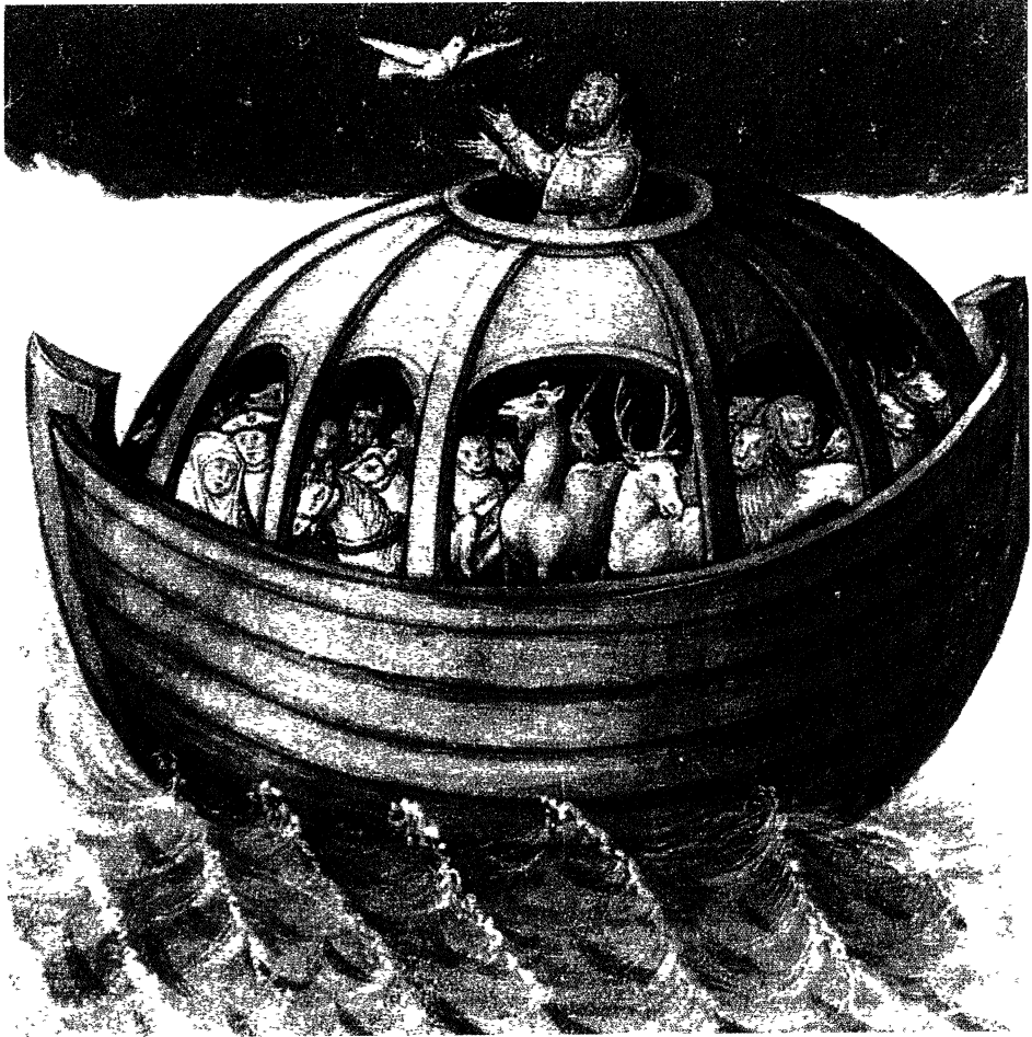
Fermosa representación da Arca de Noé. Claro exemplo dun mandato de conservación das especies animais "Espello da humana salvación" Manuscrito do século XV, Museo Condé, Chantilly. Los animales en el Arte , ed. Argos, 1974

vivir debe respectar toda forma de vida, intentando en todo o posible absterse de destruír unha vida, sexa cal sexa a categoría á que pertenza". Só desenvolvendo unha nova sensibilidade cara ó valor intrínseco da natureza, se poderá conte-la desmesurada consi-