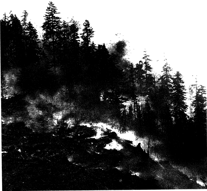
A madeira. Un colosal incendio, en agosto de 1996, converteuse nun dos lumes máis intensos e devastadores, chegando mesmo a estenderse ó estado de Oregón e atravesando o lume a ladeira da montaña. Ed. Blume, 1978