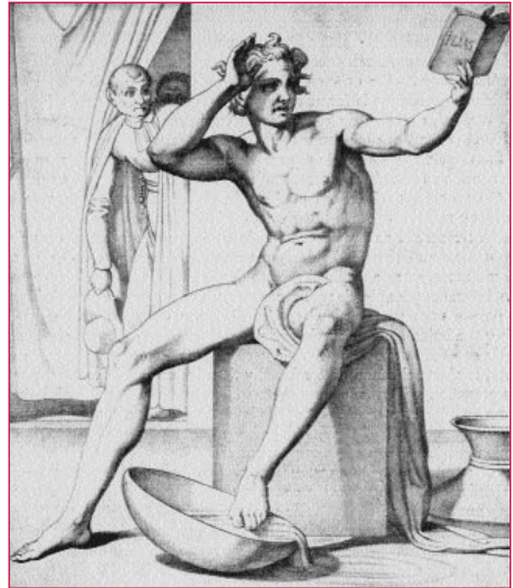
Mozo lendo a Homero. Genelli, século XIX.

Neste sentido teño que referirme a unha experiencia persoal. No verán de 1985, fun invitado a participar nas Xornadas de Cabueñes, organizadas polo Instituto da Xuventude. Nunha mesa redonda na que participei, expúxose o "Informe sobre a xuventude" (estabamos no Ano Internacional da Xuventude) ó que presenteí algunhas observacións no sentido de que os datos de base da enquisa de 1984 foran tomados en 1983 e xa estaban desfasados. Na primavera de 1987 tivo lugar a mobilización xuvenil dos alumnos de bacharelato entre os 15 e os 17 anos, que dous anos antes non foran incluídos no universo