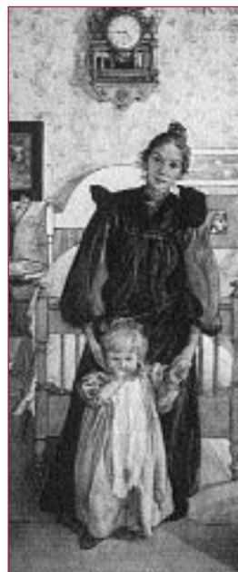
Karin e Kersti . Acuarela de Carl Laresson, 1898.

O ámbito familiar segue a se-la escena educativa de primeira orde.