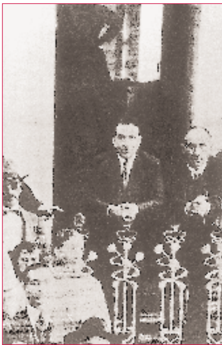
No balneario de Mondariz, cun descoñecido.

A rica colonia galega da Habana vai dirixir marcadamente o devir da cultura galega destes anos. É na Habana onde, de feito, nace a Real Academia Galega (se ben a súa formalización se realiza na Coruña por Manuel Murguía) a iniciativa de