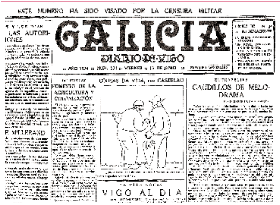
Cabeceira de Galicia-Diario de Vigo .