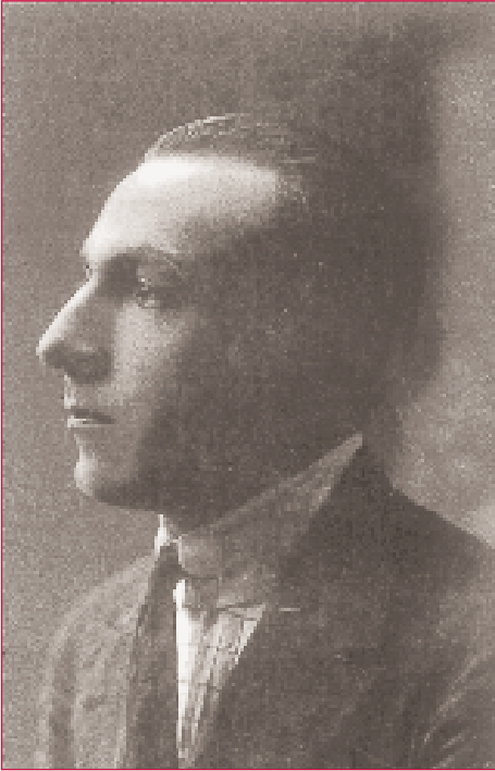
En Ourense nos primeiros anos vinte.