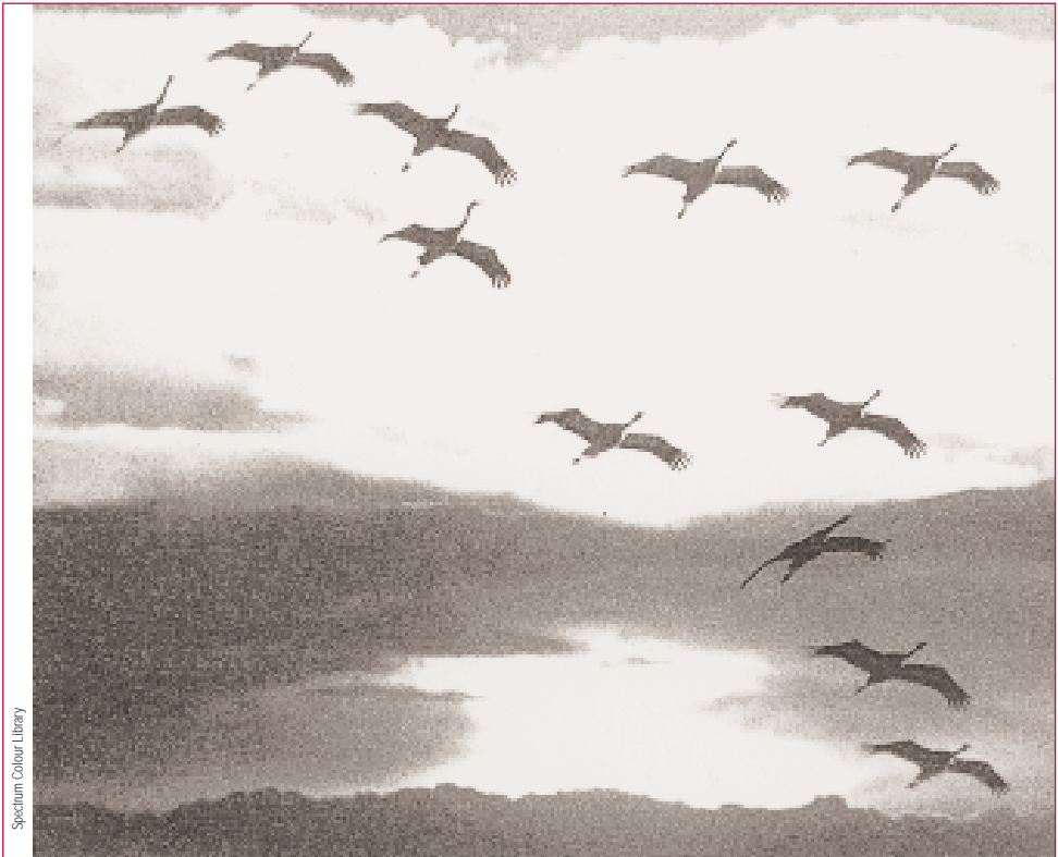
Migración de grou. Os costumes ou reaccións sociais dun grupo de individuos no seu ciclo de desenvolvemento é sinal de vida.

viduo, ó ecosistema ou mesmo á sociedade, no caso do home e de animais con estruturas semellantes (formigas, abellas, aves migratorias). Sempre ocorre que nas estruturas xeradas como consecuencia de agregacións doutras de menor nivel, aparecen características que non son a suma das que tiñan os compoñentes por separado. O funcionamento do cerebelo vai moito máis aló da suma das funcións das diferentes células que o compoñen, o mesmo