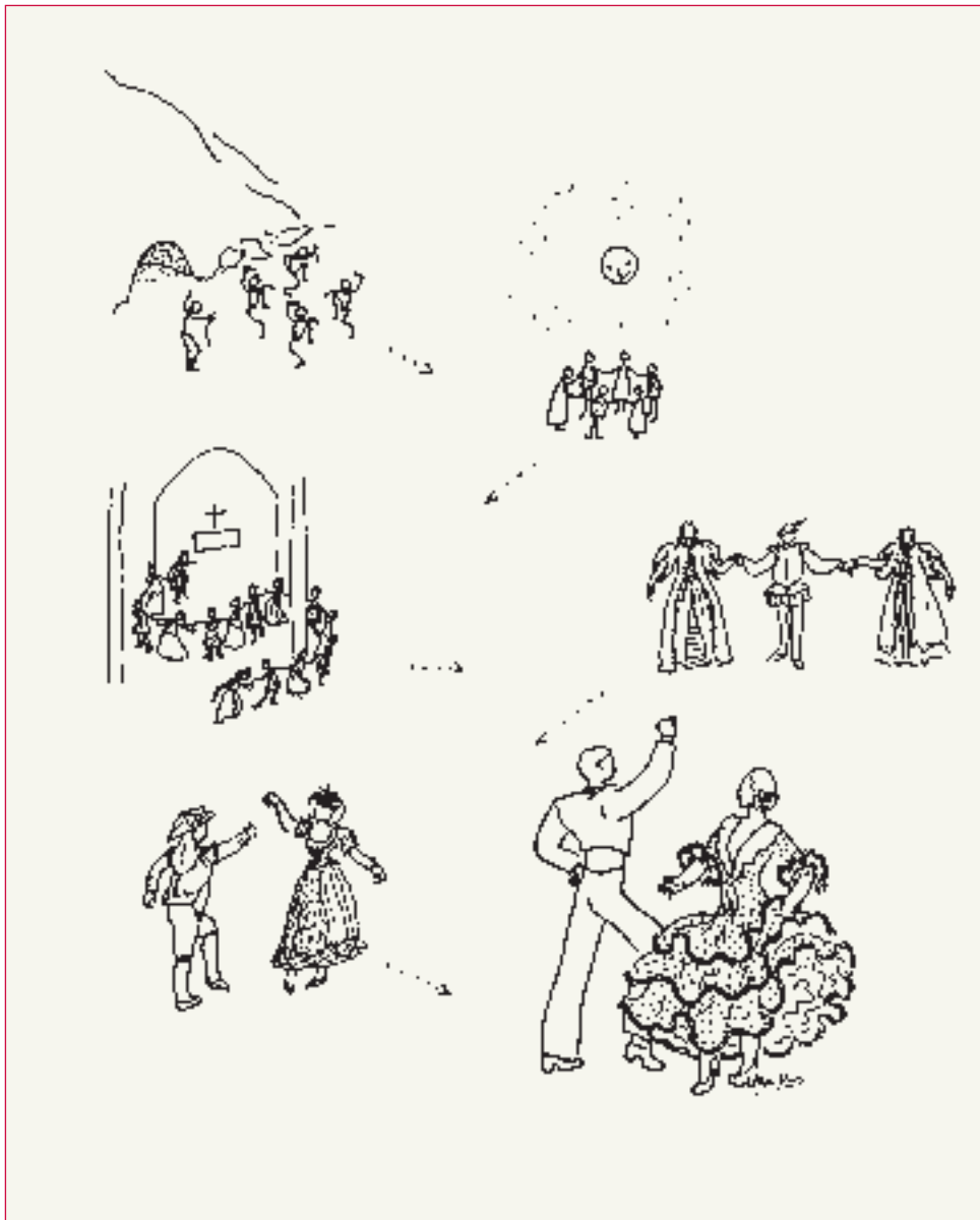
Datos históricos da Danza en España. Orixes-Idade Antiga-Idade Media-Renacemento-Século XVIII- Actualidade. Debuxos da autora.