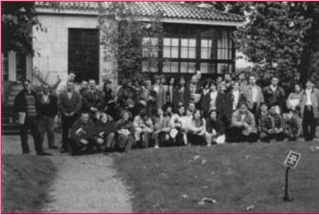
Curso sobre o mundo botánico dos pazos galegos (ano 1995).

colaboracións institucionais e, sempre, co apoio dos familiares dos alumnos.