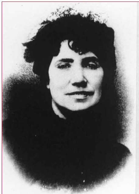
No xardín municipal, Rosalía de Castro compuxo algúns dos seus sentidos poemas.