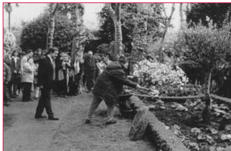
Plantación da Oliveira do Sexto Centenario, conmemorativo da fundación do Mosteiro de Herbón.

Se o Trimestre de Charlas é a actividade estrela que organiza o Xardín Botánico, o Día da Árbore é a máis entrañable, neste caso restrinxida a un ámbito local, onde a comunidade escolar padronesa, pensando na árbore como embaixadora do mundo vexetal, cada ano que pasa, desde 1994, está a escribir unha nova e fermosa páxina no libro verde, cheo de paisaxes, xardíns e