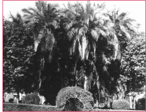
Palmeira do Senegal, formación arbórea monumental e etnocultural do país galego.

É obrigada a súa presentación: a Palmeira do Senegal ( Phoenix reclinata ), a “Coroa de Cristo” ( Cercis siliquastrum ), as Sequoias Vermellas —de Rosalía de Castro e de Macías o Namorado— ( Sequoia sempervirens ), o Carballo Fastigiado ( Quercus robur ‘Fastigiata’), o Castiñeiro das Indias ( Aesculus hippocastanum ), a Árbore do Coral ( Erithryna crista-galli ), o “Sombreiro de Copa” ( Juniperus recurva ) e o