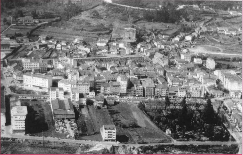
Vista aérea de Padrón e o Xardín Botánico-Artístico, instrumento educativo-cultural.

transición, representado por los jardines hortícolas, en los que se muestra una dualidad productora y recreativa, aparecen finalmente los jardines ornamentales. Pasado, presente y futuro de una manifestación artística y de un quehacer que están indisoluble e inevitablemente asociados a la presencia humana. A sus inquietudes, se debe esta progresión que convierte a la Naturaleza en jardín. A fuerza de tiempo, de muchos siglos, la creación natural del Dios omnipresente se complementa con la creación artificial del hombre, artífice de innumerables ensayos y proyectos que hoy cristalizan en alamedas, jardines y parques, rurales y urbanos, que llenan de vida, salud y color los lugares que habita (Rodríguez Dacal, 1997).