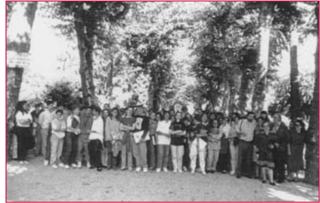
Visita ó Xardín Botánico do Instituto Rosalía de Castro (Santiago de Compostela), no ano 1992.

O ano 1992 é o da posta en marcha da actividade estrela do Xardín Botánico, aínda que con anterioridade xa colaborou coa Ruta Rosalía de Castro-Tren-Caixa de Galicia, promovida e patrocinada por Caixa Galicia e Renfe, coa participación dos concellos de Santiago de Compostela e Padrón, o