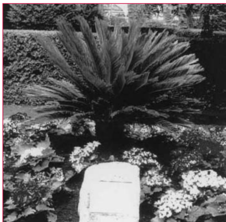
Sagú da Comunidade Escolar, símbolo da irmandade entre o xardín e o maxisterio local.

Trátase das plantas con historia, grupo ó que pertencen, en boa lóxica, as árbores monumentais. Dun tempo para acá, o Xardín Botánico-Artístico pon especial esmero na potenciación deste colectivo, cunha plantación simbólica anual coincidindo coa celebración do Día da Árbore. Despois de varios anos deste quefacer, o inventario de plantas con historia conta xa con nove rexistros máis, que enumeramos a seguir nunha orde cronolóxica.