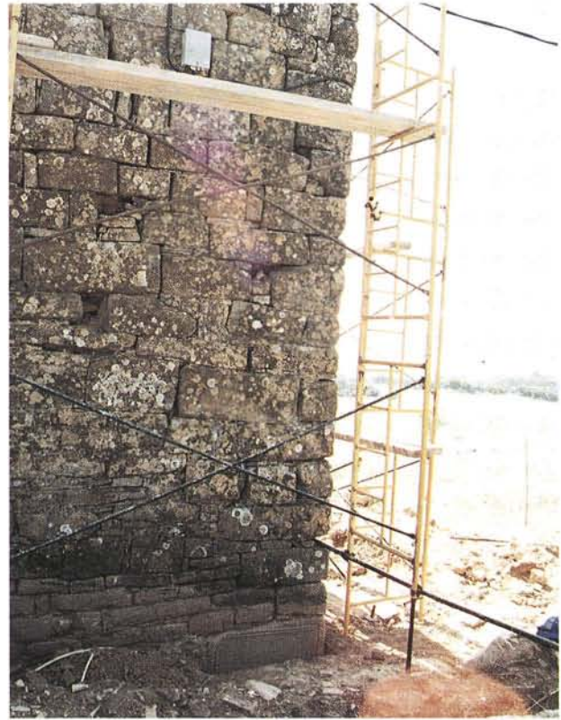
Iglesia de Eristáin