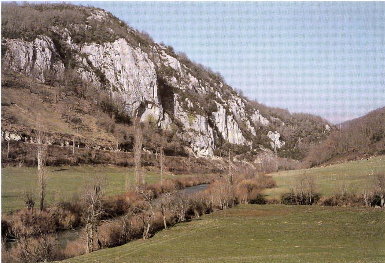
Situación del abrigo de Aizpea, a orillas del Irati.