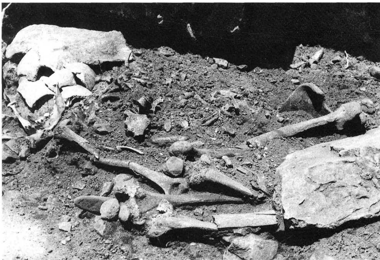
Aizpea, campaña 1991.