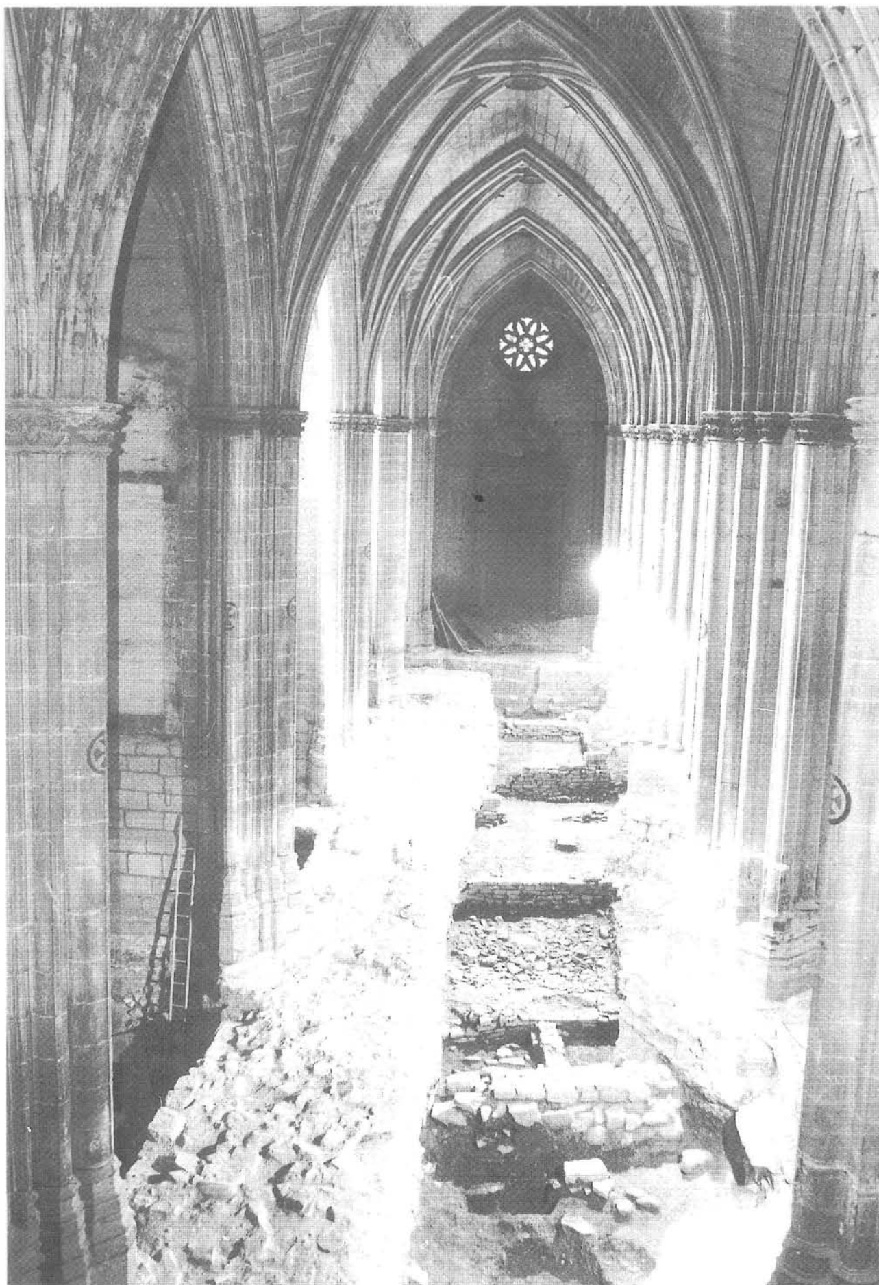
Excavaciones en la catedral de Pamplona.