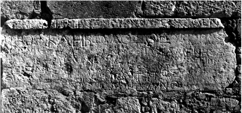
Figura 1. Inscripción de Polirrenia, ICret.II.XXIII , 30.