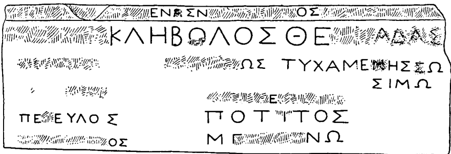
Figura 3. Copia de la inscripción de M. Guarducci.