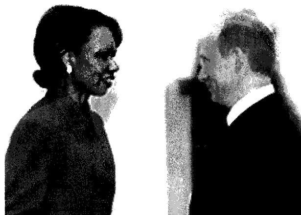
Condoleezza Rice y Vladimir Putin

¿Es tan cierta esa posición de Putin? ¿Es cierto ese declarado respeto a no mancillar ni en aras de la lucha contra el terrorismo la libertad de prensa? No todos piensan que la respuesta es verdadera e incluso señalan que Putin va consolidando un sistema de culto a la personalidad, como el visto durante la era de los zares comunistas, donde solo se escribe lo positivo y donde el escribir críticas implica perder anuncios comerciales, lo que lleva a los medios a morir. Aunque, para ser justos, también hay que considerar que viendo los últimos 150 años de historia rusa, por no ir más atrás, no hay tradiciones ni raíces de libertad de prensa, ni de democracia. No se puede olvidar que al derrumbarse la Unión Soviética, Yeltsin trajo aires democráticos pero a costa de un tremendo caos, sobre todo económico, y el Ejército quedó en desbandada.