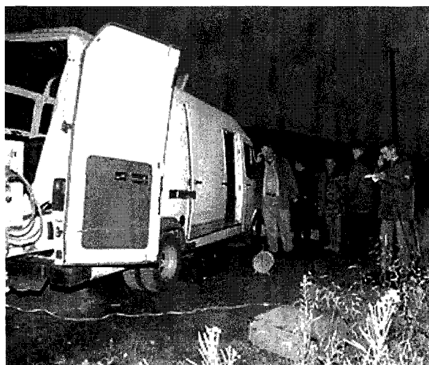
La nueva política abarcó a la televisión

E incluso recoge un concepto más moderno: hay que unificar la información con una infraestructura perfecta, ante amenazas como la Guerra Informativa que pretende obstruir los flujos normales de información y telecomunicación, minando la integridad de las fuentes de información. Esa nueva Doctrina