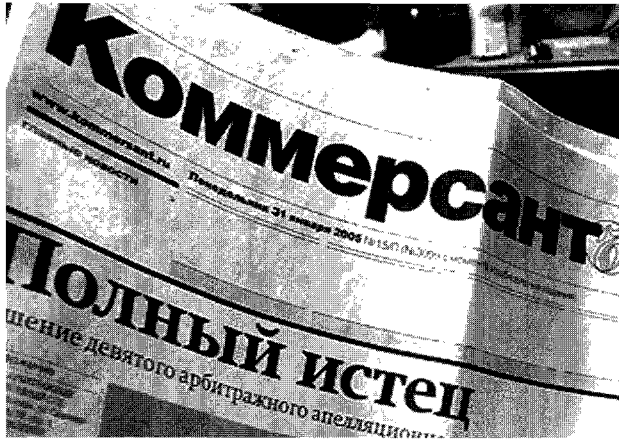
El primer diario independiente

500 empleados, incluidos más de 100 periodistas, y es muy posible que no tenga publicidad para, dijo RIA-Novosti , elevar el estatuto de canal público, lo que le daría un alto estándar entre los espectadores. Lo cierto es que a mediados de septiembre de 2005 Russia Today inició sus primeras transmisiones de prueba presentando una paseo por el canal, un reportaje sobre Mikhail Kasyanov, otro sobre el magnate petróleo Mikhail Khodorkovsky, otro sobre la Cumbre de la ONU en Nueva York y otro sobre el huracán Ofelia que golpeó a Carolina del Norte. Russia Today tiene un presupuesto de 30 millones de dólares, garantizado desde las arcas oficiales y sus mercados están en América del Norte, Europa y Asia.