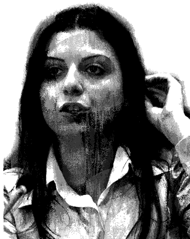
Margarita Simonyan encabeza la televisora estatal