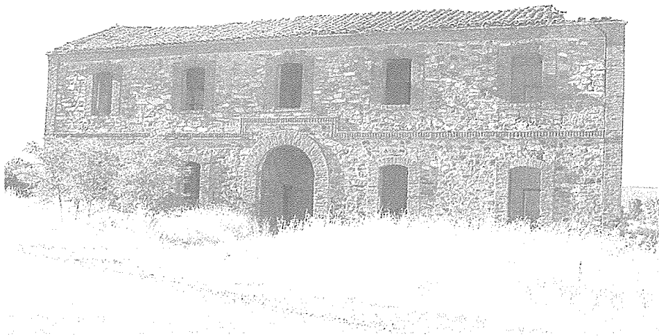
Casa del Priorato de Villaverde

En cuanto a la capilla o ermita y aledaños, contamos con una excelente descripción, a medio camino entre la crónica literaria y el análisis artístico, publicada por E. Sáinz hace unos años en la prensa local: