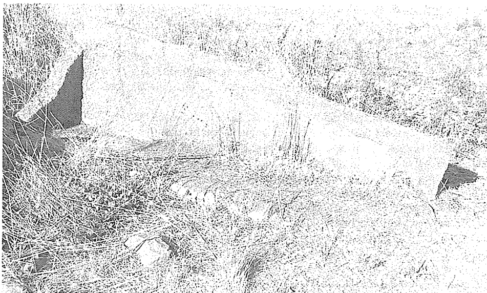
Sarcófago monolítico parcialmente mutilado

A partir de este momento el monasterio de San Salvador de Villaverde entra en una época ciertamente oscura. Muñoz Miñambres recoge la noticia de que pudo pasar a depender en algún momento de los Templarios, siguiendo informaciones tomadas del archivo del Hospital de la Piedad, que no he logrado localizar. Extinguida la Orden en 1311, habría sido adjudicado con todas sus haciendas y derechos por los “reyes” al monasterio de Sahagún 19 . Lo cierto es que en el Libro del Priorato no consta tal traspaso o usurpación, y más parece que lo que pueda existir en el archivo benaventano no sea más que una suposición o afirmación interesada de los condes para justificar su apropiación posterior. La presunta usurpación de iglesias y monasterios por los Templarios ha sido una constante en la historiografía monástica, y eclesiástica en general, más militante. Aunque puede existir un fondo de veracidad, en estas afirmaciones no deja de manifestarse un componente propagandístico e interesado para justificar la ausencia de títulos de propiedad y reclamar posteriormente presuntos derechos o rentas.