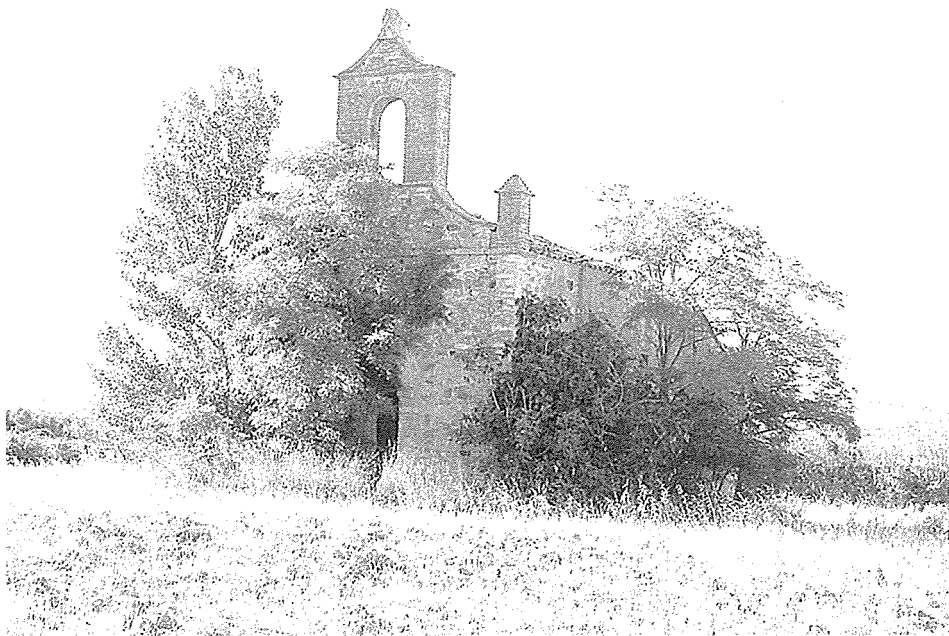
Ermita del Priorato de Villaverde

En el mencionado documento, correspondiente al año 1100, Alfonso VI relata como disfrutando de la posesión del cenobio el conde Munio Fernández, pasó a manos del rey, según la costumbre del reino dada la “soberbia” del conde, que le hizo padecer destierro 6 . Debió tratarse, por tanto, de una confiscación muy al uso en la época, fruto de la caída en desgracia del noble, producto de una tentativa de rebelión 7 . Este mismo monarca cedió en 1097 a la catedral de León sus derechos en cinco porciones del monasterio de San Salvador de la Polvorosa, entre los ríos Esla y Órbigo. Sus anteriores propietarios habían incurrido igualmente en la ira regia por diferentes motivos. La terminología utilizada por el rey para justificar la apropiación en este caso es prácticamente idéntica: per consuetudinem patrie nostre de supra scriptis hominibus iure hereditario adquisiui 8 .