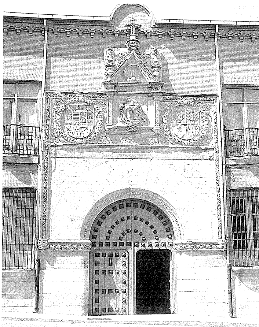
Portada principal del Hospital de la Piedad de Benavente

Los dos edificios que hoy podemos contemplar apenas presentan algún interés artístico, aunque mantienen todo el encanto romántico de las ruinas decrépitas. En primer lugar una construcción de dos plantas, de grandes proporciones, con su fachada principal presidida por un gran arco de medio punto. Se empleó aquí una alternancia de muros de sillarejo y ladrillo rojo, utilizando básicamente este último como elemento decorativo, especialmente en el enmarcamiento de los amplios vanos de los dos cuerpos del edificio. Todo ello parece relativamente moderno, de finales del siglo XIX o principios de la centuria siguiente. Se trata de la residencia de los sacerdotes, en la que se incluye un amplio patio o corral para el servicio de caballerías y animales domésticos.