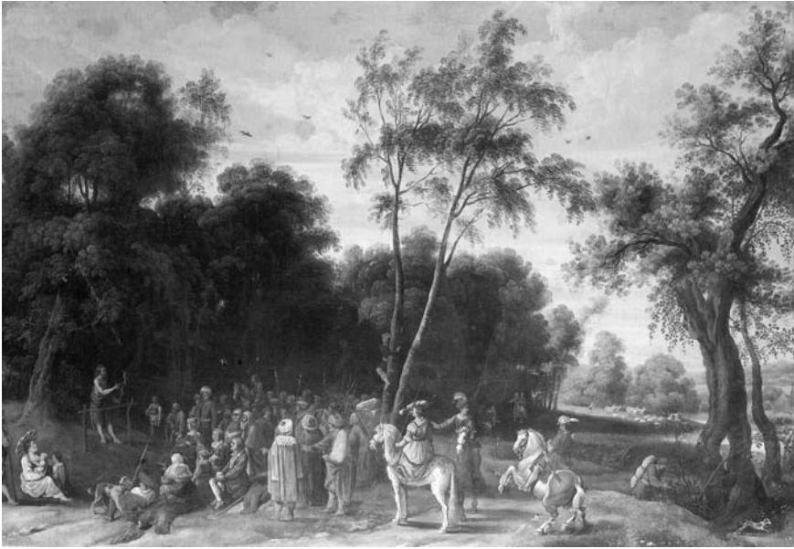
Figura 2. J. Wildems. Paisaje. Colección privada. Madrid