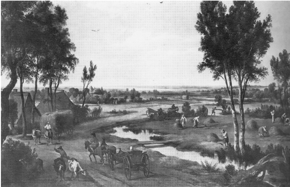
Figura 5. J. Wildems. Paisaje. Galería de Palazzo Bianco. Genova