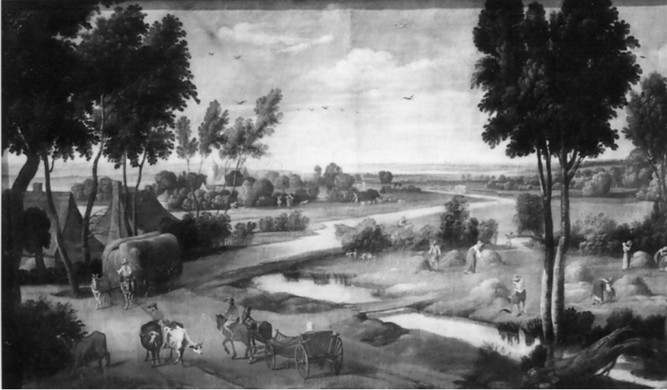
Figura 4. J. Wildems. Paisaje. Museo del Prado. Madrid