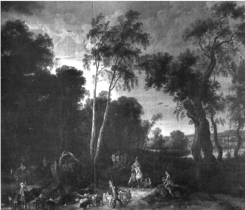
Figura 3. J. Wildems. Paisaje. Museo del Prado. Madrid