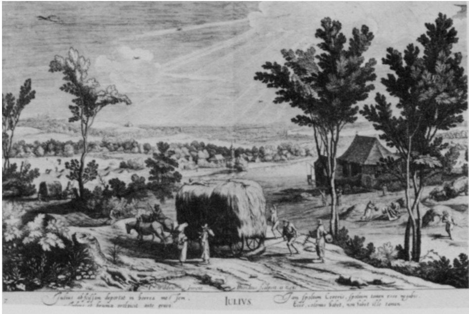
Figura 6. H. Hondius, según J. Wildems. Julio. Grabado