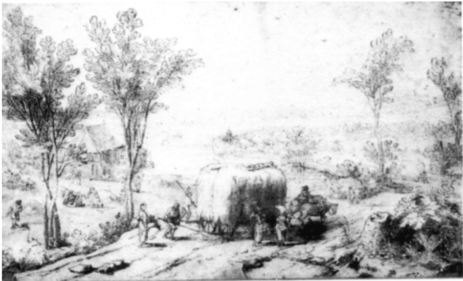
Figura 7. J. Wildems. Dibujo. Gabinete de estampas. Munich