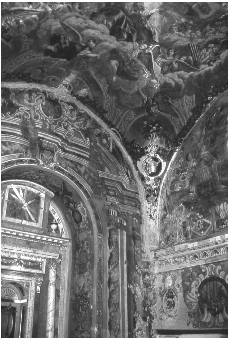
Figura 3. Burgos. Cartuja de Miraflores. Capilla de la Virgen de Miraflores. H. 1648.