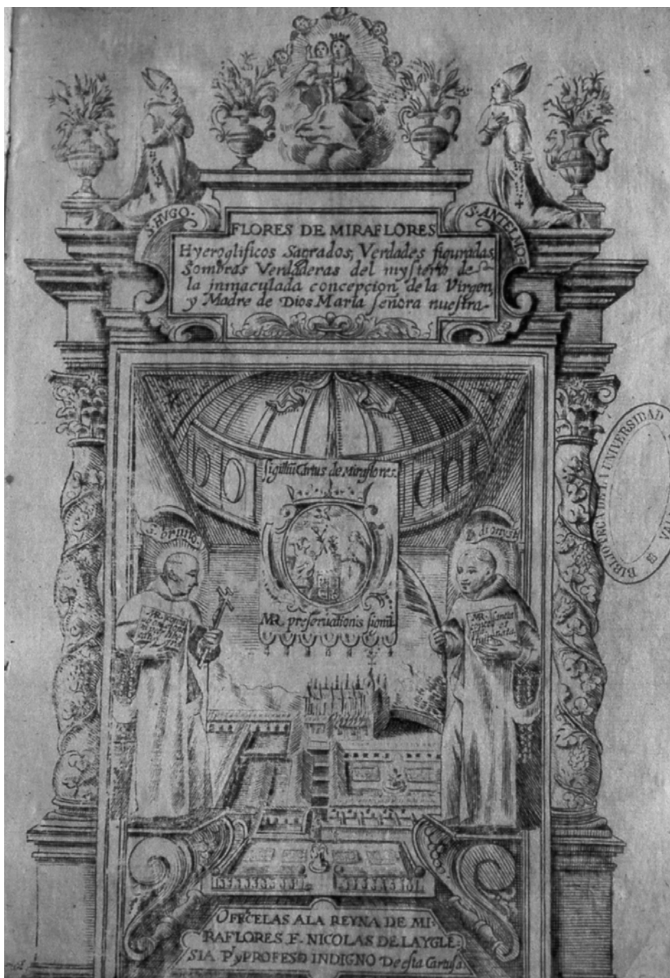
Figura 1. D. Nicolás de la Iglesia, Flores de Miraflores , Burgos, 1659. Portada.