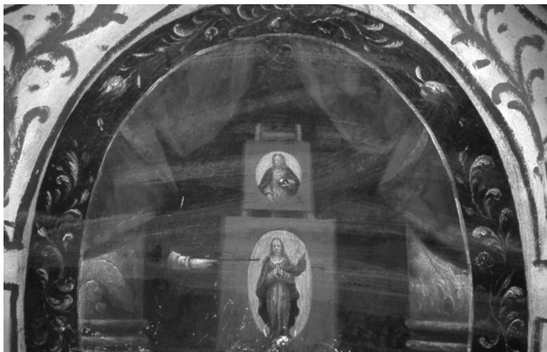
Figura 5. Burgos. Cartuja de Miraflores. Capilla de la Virgen de Miraflores. H. 1648. Emblema “Forma Dei”.