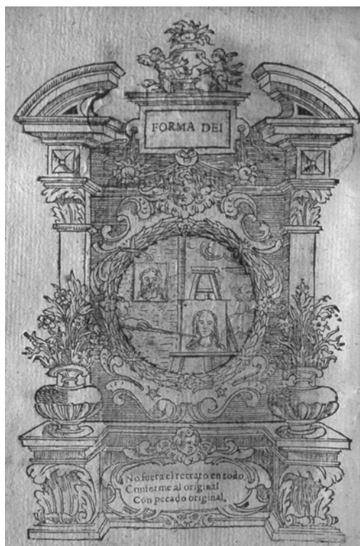
Figura 6. D. Nicolás de la Iglesia, Flores de Miraflores , Burgos, 1659. Emblema III: “Forma Dei”.