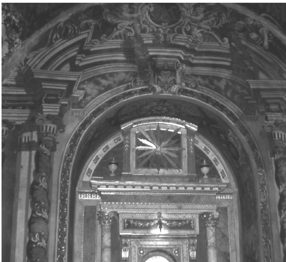
Figura 2. Burgos. Cartuja de Miraflores. Capilla de la Virgen de Miraflores. H. 1648. Retablo