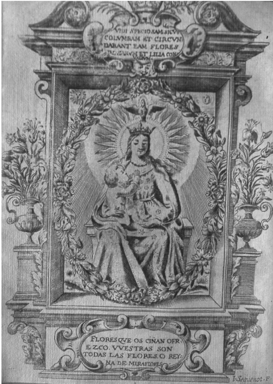
Figura 4. D. Nicolás de la Iglesia, Flores de Miraflores , Burgos, 1659. Grabado de la Virgen.