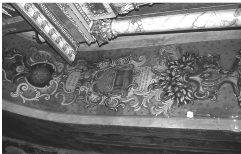
Figura 9. Burgos. Cartuja de Miraflores. Capilla de la Virgen de Miraflores. H. 1648. Emblema "Mensa Panum". - Figura 10. D. Nicolás de la Iglesia, Flores de Miraflores , Burgos, 1659. Emblema XXXV: "Mensa Panum".