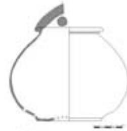
6 - Situla