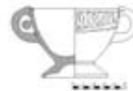
9 - Copa