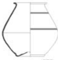
10 - Vasija globular