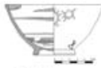
8 - Cuenco