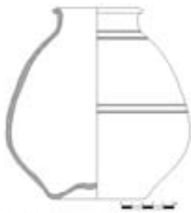
1 - Botella