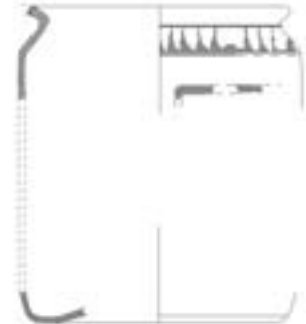
3 - Vaso troncocónico