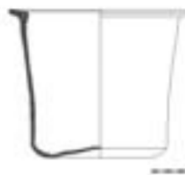
11 - Kalathos