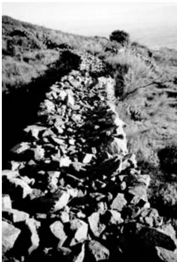
Fig. 5. Detalle de la muralla.

recinto; sin embargo, conocemos bien el funcionamiento de las puertas en los castros vetones: en embudo y en esviaje. El acceso en embudo es el más frecuente y se realiza mediante la abertura que ofrecen los dos lienzos de la muralla al incurvarse hacia el interior formando un callejón estrecho (Las Cogotas). La puerta en esviaje consiste en la disposición en paralelo dejando un espacio libre entre ambos que permite el paso (tercer recinto de la Mesa de Miranda) (ÁLVAREZ-SANCHÍS, 1999: 133 y ss.).