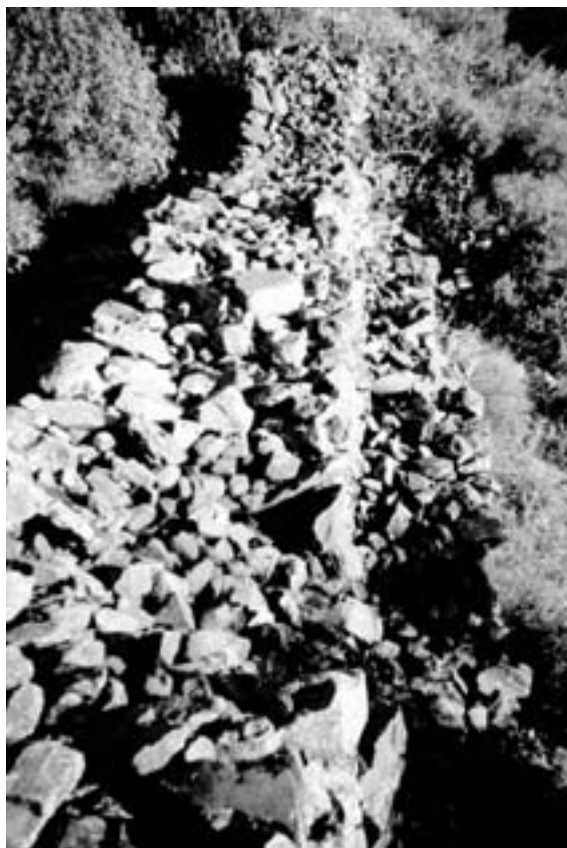
Fig. 6. Detalle de los contrafuertes de la muralla.

No se han documentado fosos, tal vez porque lo inaccesible del terreno hace innecesario este tipo de defensas. Más comunes en los poblados vetones son los campos de piedras hincadas, que en el caso que nos ocupa tampoco se documentan. Se ha supuesto que estas barreras dificultaban los ataques de la caballería o la llegada en tromba de los atacantes a pie (ibídem: 136). En nuestra opinión, este tipo de barreras se disponían para dificultar el acceso de las máquinas de asedio y la caballería, y en este caso, dado lo complicado de la orografía, este tipo de defensas carece de sentido. El castro de la sierra de la Estrella presenta un sistema defensivo aún más sen-