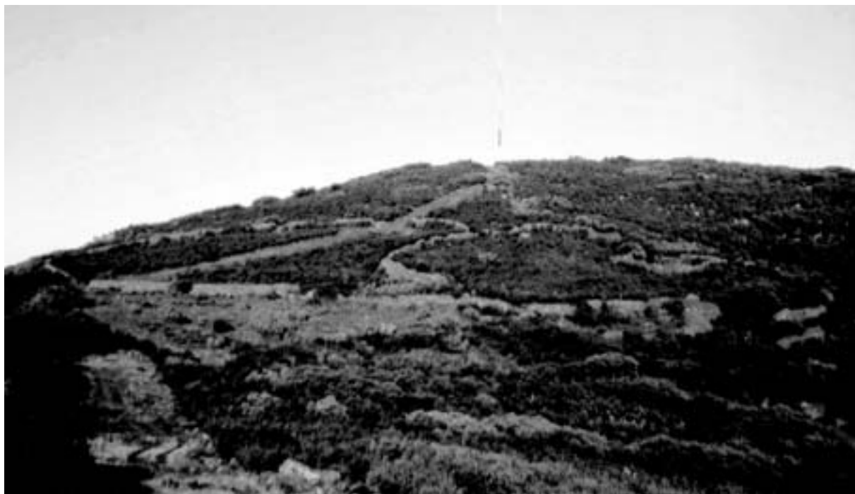
Fig. 4. Vista general del castro de la sierra de la Estrella.

La muralla no presenta un trazado rectilíneo y está reforzada por contrafuertes en algunos de sus tramos. No se han podido identificar los accesos al