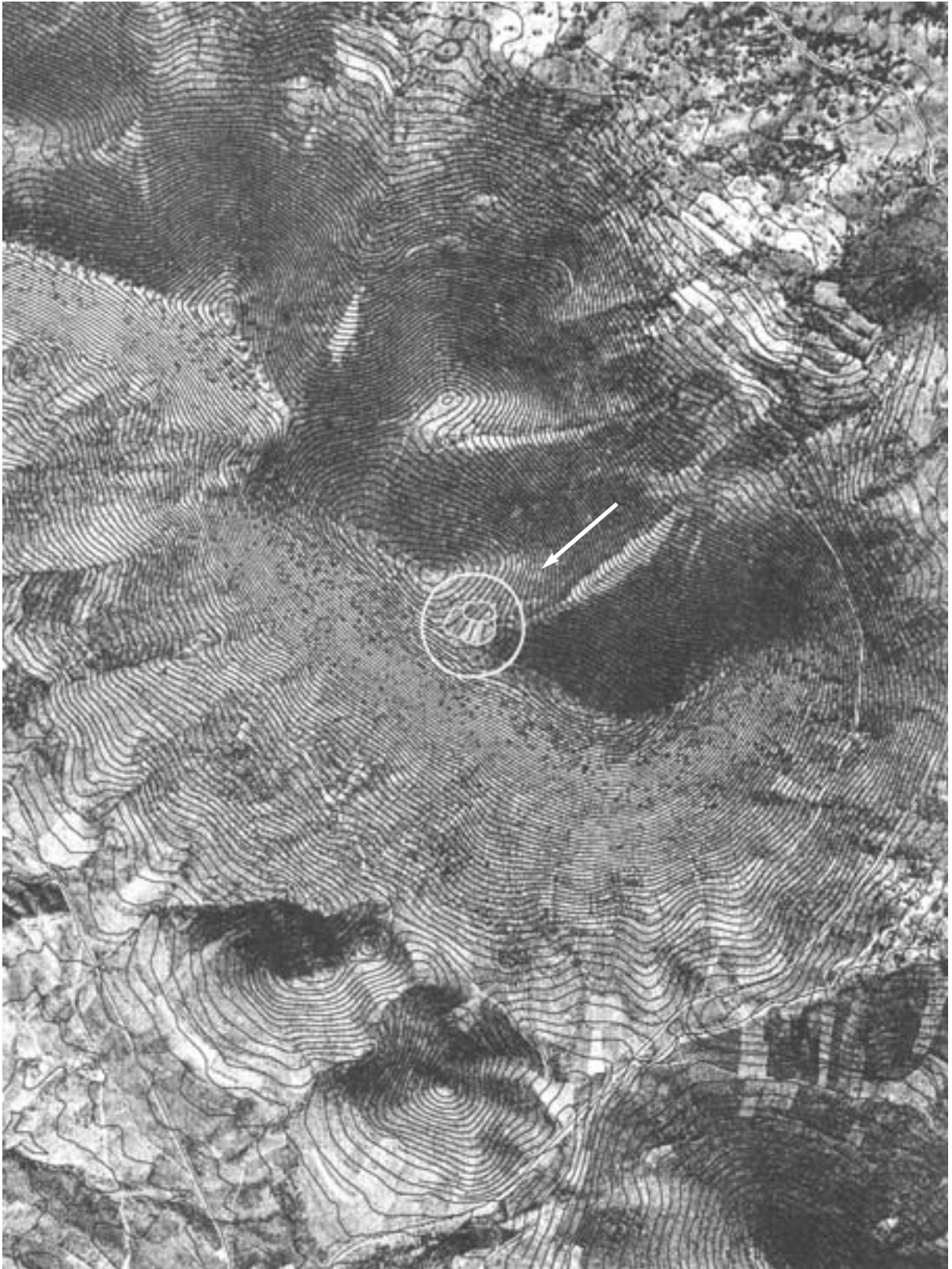
Fig. 1. Ubicación del castro de la sierra de la Estrella (escala 1: 15000).