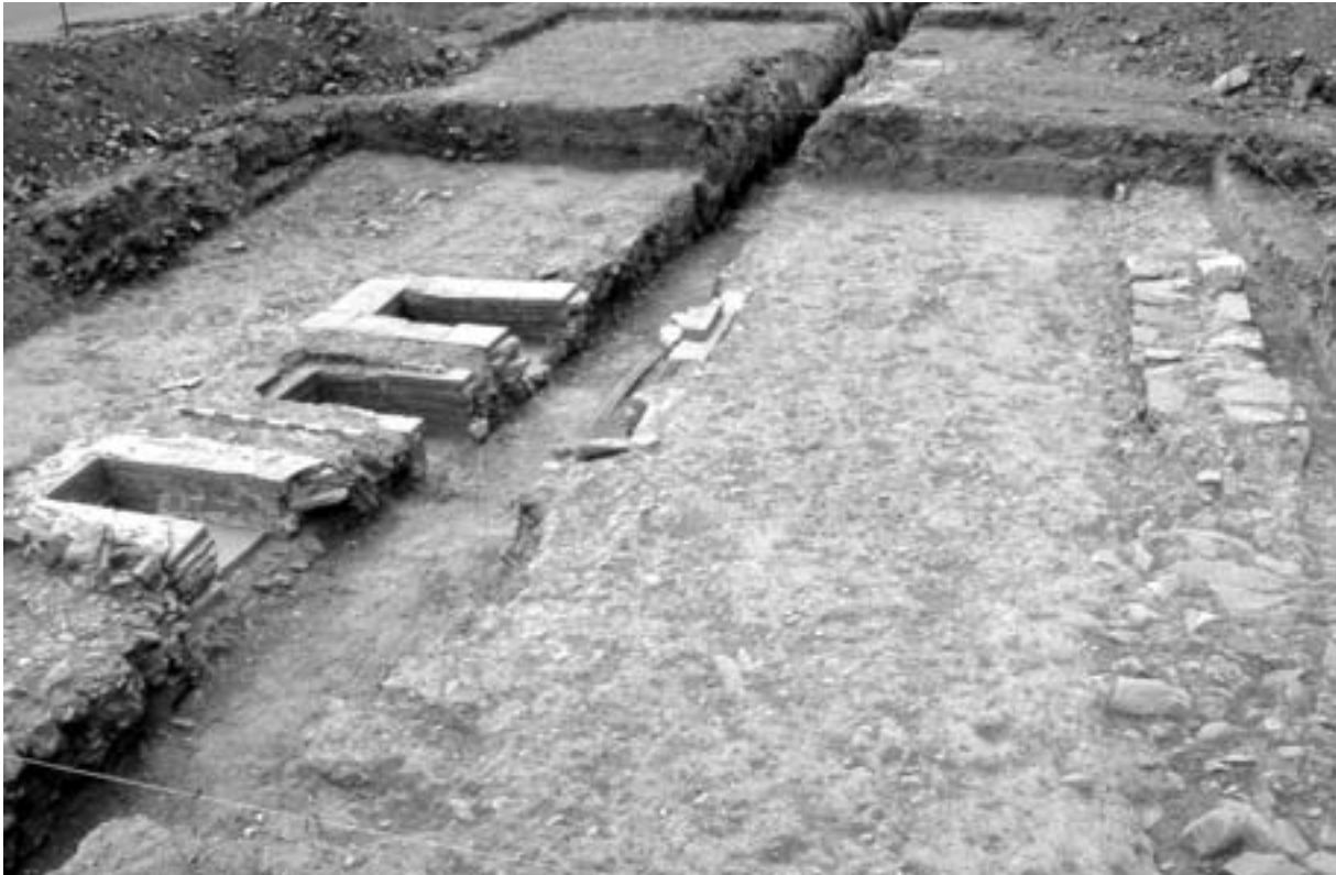
Fig. 3. Aspecto del recinto funerario. En la zona central se puede apreciar la zanja que destruyó parcialmente las tres inhumaciones. A la derecha, el muro que lo delimitaba por el este.