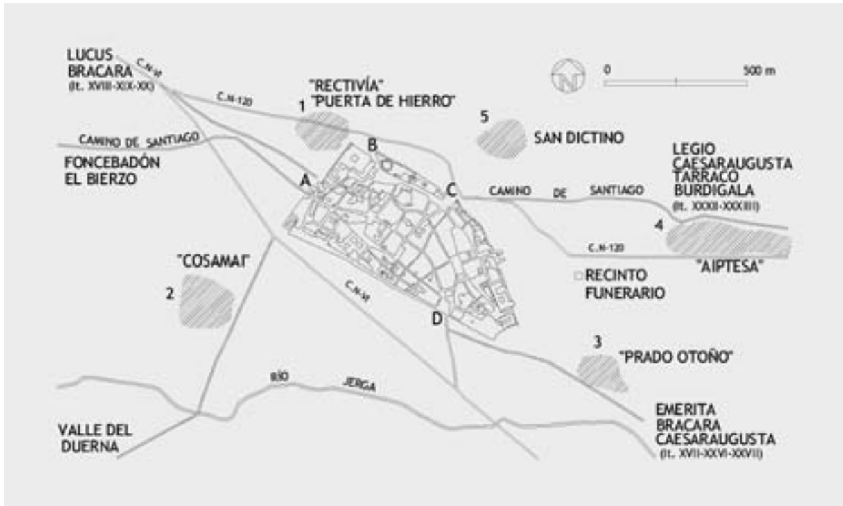
Fig. 2. Astorga. Vías de posible origen antiguo, áreas con hallazgos de enterramientos y puertas de acceso a la ciudad: A. Puerta Obispo. B. Puerta Romana y Puerta de Hierro. C. Puerta del Rey. D. Postigo de San Julián. El recinto funerario se encuentra entre las áreas de necrópolis 3 y 4.

establecer la situación topográfica de las necrópolis a las que se asociaban—, no permite, sin embargo, determinar de forma precisa o concluyente la ubicación de aquellas. Por ejemplo, la inmensa mayoría de los monumentos funerarios se han encontrado embutidos en la muralla, en la que se han empleado como material constructivo, una vez que han perdido su inicial valor simbólico y religioso. Únicamente puede atisbarse, debido a la misma procedencia de seis epígrafes, la situación de una de las necrópolis. Se encontraría al este de la ciudad, en torno al actual barrio de San Andrés —inmediato al espigón surenoriental del recinto amurallado— y del pago denominado Prado Otoño , presencia que, además, vendría corroborada por alguno de los escasos hallazgos arqueológicos de enterramientos romanos de los que se tiene conocimiento en la historiografía de la ciudad. En efecto, el erudito M. Macías recoge, en una conocida y valiosa obra sobre la epigrafía romana de la ciudad (MACÍAS, 1903), el hallazgo en 1888 de una sepultura de incineración en el pago aludido de Prado Otoño (fig. 2, n.º 3), al realizar las obras de construcción de la línea férrea Astorga-Plasencia. Se trataba de una tumba realizada con ladrillos y mampostería, que albergaba una caja de plomo en cuyo