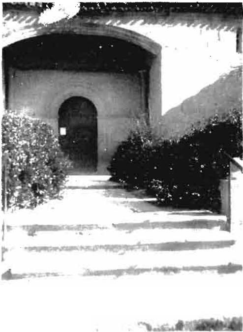
Atrio parroquial del lugar de Elorz.