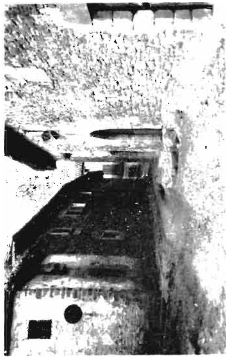
Una calle de la aldea de Elorz, con olor de siglos.