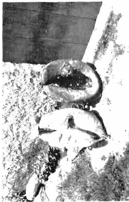
Collarones de labor para las caballerías.