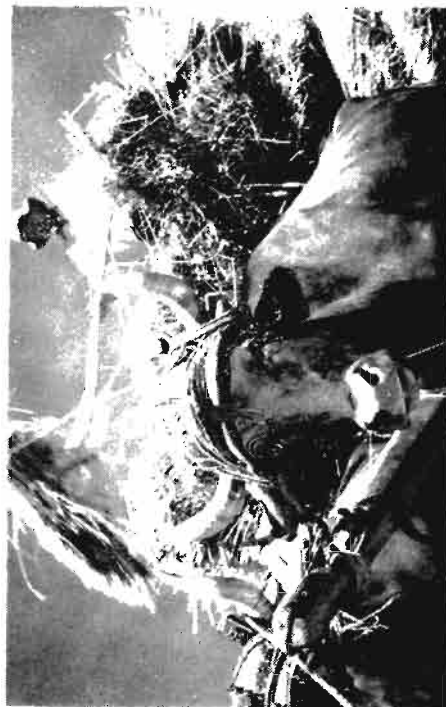
La tradicional estampa de los buyes en la faena de la recolección. Desaparecida en la actualidad en Valdeorza y sus alrededores.