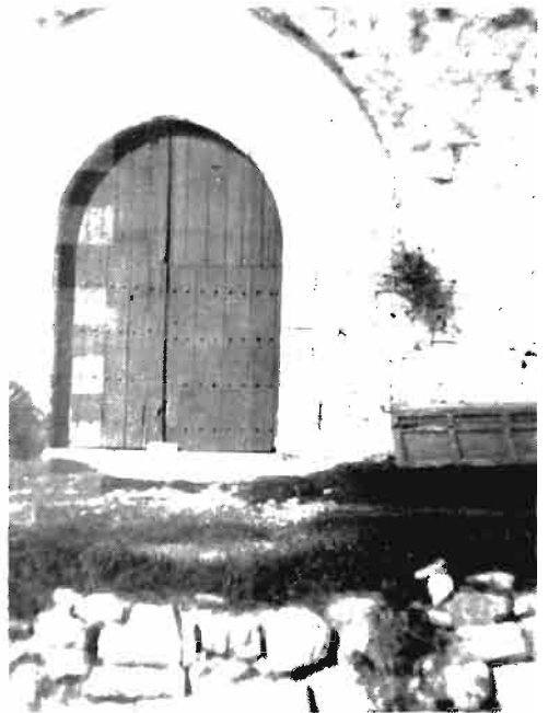
Puerta de una casa de labranza en Zulueta.