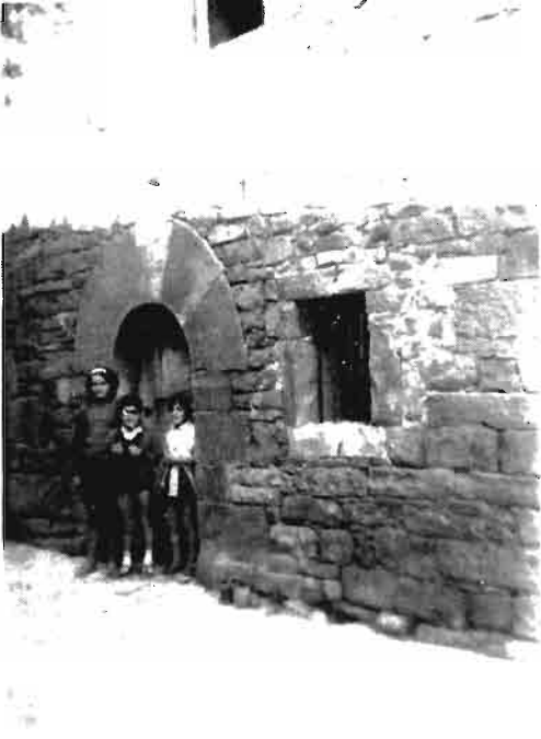
Hasa las casas más humildes del Valie, lucían su majestuoso portal de medio punto.