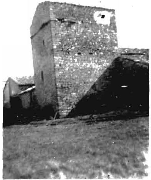
Antigua Torre de Zabalegui, actualmente casa de labranza.