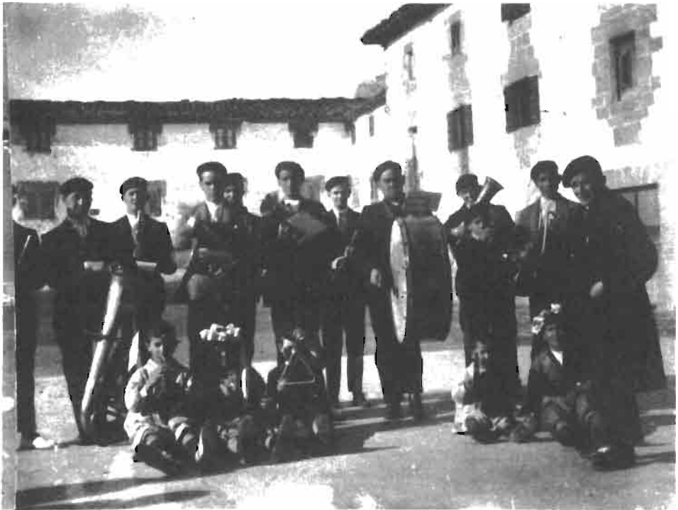
«Banda de música en Ibero (Olza) hacia el año 1930».