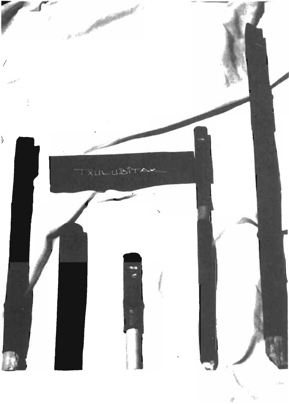
«Txulubitas de diferentes localidades del País Vasco».