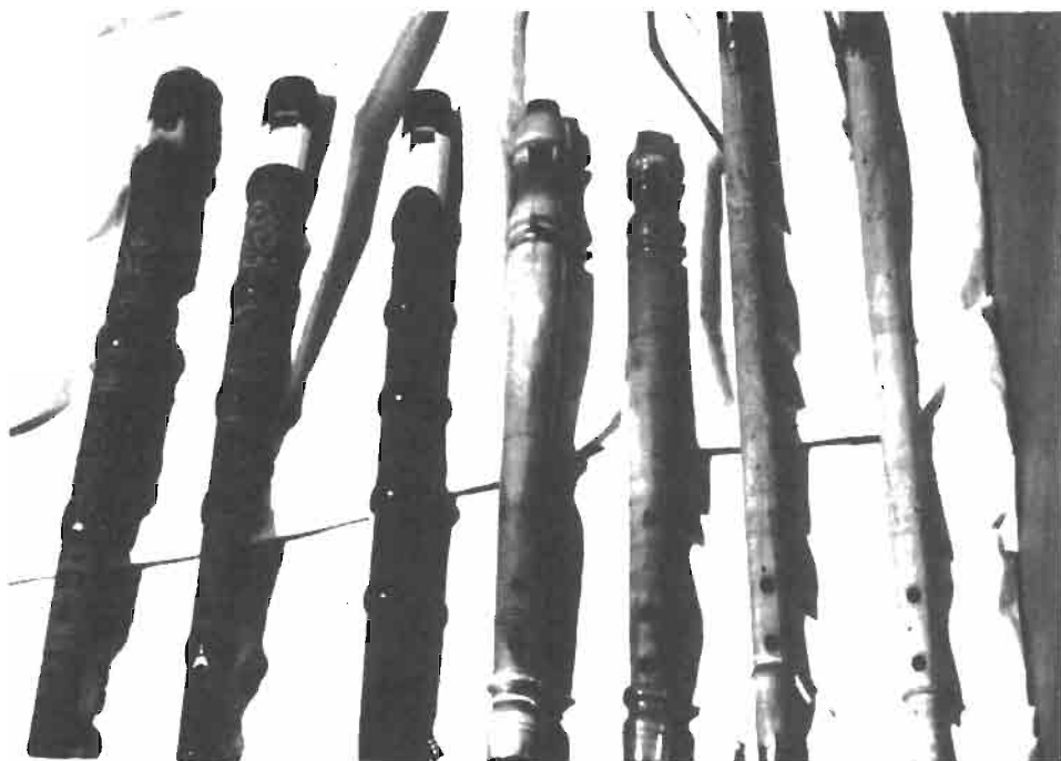
«Flautas de 3 agujeros procedentes de Salamanca, León e Ibiza».

23-24. Flautas de tres agujeros de Ibiza.