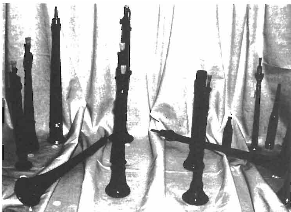
«Diversos instrumentos de doble lengüeta».