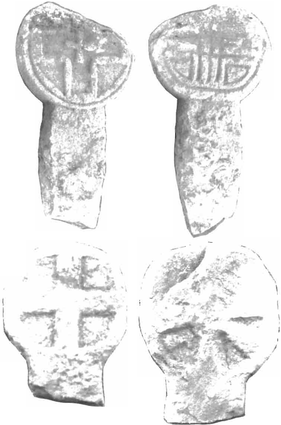
LAMINA IV. Estelas 3 y 4 de Baigorri.