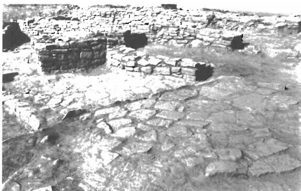
LAMINA II. Excavación del Señorío de Baigorri.