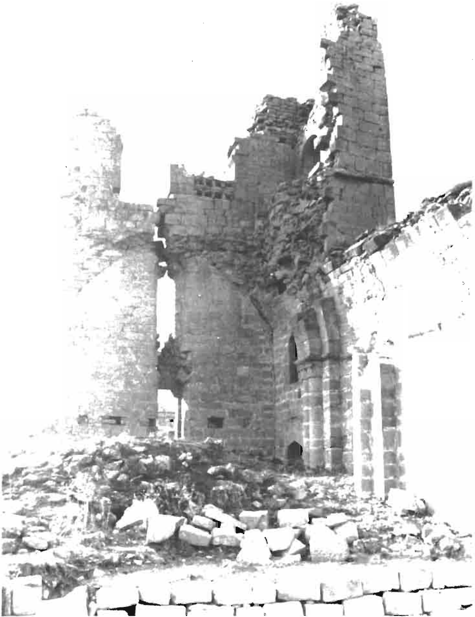
LAMINA I. Iglesia del Señorío de Baigorri. Oteiza de la Solana, Navarra.