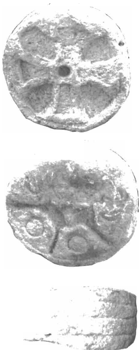
LAMINA VI. Estela 6 de Baigorri.