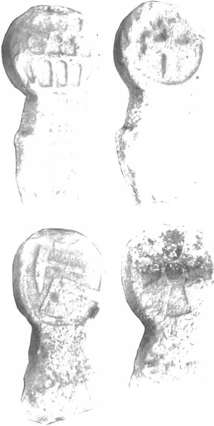
LAMINA III. Estelas 1 y 2 de Baigorri.