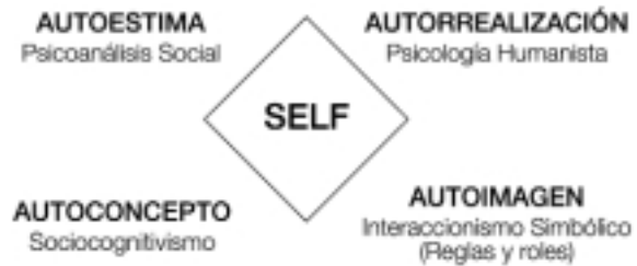
FIGURA 2 MODELO DE LAS CUATRO CARAS DEL SELF

Fuentes: Codina (2000). Basado en Munné (1998).