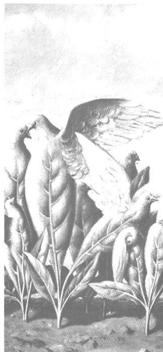
RENÉ MAGRITTE. (detalle) La isla del resaca . 1942 Oleo sobre lienzo, 60 x 80 cm Bruselas, Musées Royaux des Beaux-Arts, obsequio de Mme Georgette Magritte

Desde esta perspectiva, Laplantine 5 construye modelos de enfermedad que no sustituyen la realidad empírica, pero ayudan a pensarla y a poner en evidencia lo que ella no dice. Los tres modelos con pares en oposición que discute, son el Ontológico/Relacional, el Aditivo/Sustractivo y el Exógeno/Endógeno. El modelo Ontológico/Relacional se muestra pertinente al discurso de nuestros pacientes, por cuanto considera la enfermedad más por el elemento