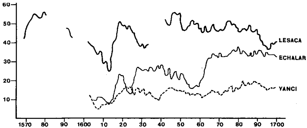
GRÁFICO 1.-Bautizados en Echalar, Lesaca y Yanci. Medias móviles 2.1.2.

comparación con el mostrado por el perfil baztanés. En la segunda mitad del siglo XVII, el retroceso del número de bautizados en Cinco Villas en 1650-1659 fue seguido por una línea ascendente, aunque a ritmo mucho más pausado que en Baztán, durante los tres decenios de a continuación. Igualmente, el declive de 1690-1720 parece haber sido en nuestra zona más intenso en cuanto a duración que el experimentado en Baztán en las dos últimas décadas del siglo.