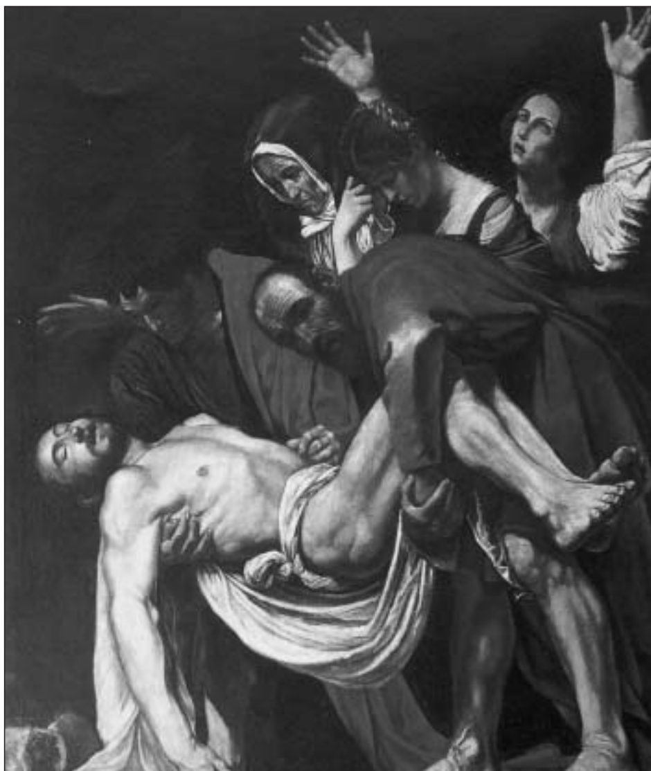
Figura 4. Entierro de Cristo , copia de Caravaggio, óleo/lienzo, 110x158 cm. Colección particular