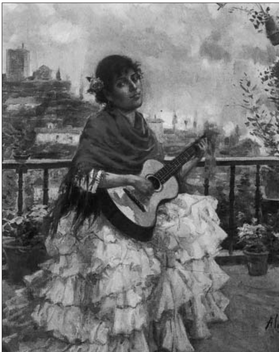
Figura 1. Gitana con guitarra , óleo/lienzo, 64x52,5 cm. Museo de Navarra

Esta obra fue depositada por la Diputación Foral de Navarra e ingresó en el museo el 20 de noviembre de 1967, dentro de un lote de doce obras, entre las que había tres más de Inocencio García Asarta 5 . Según algunos de los autores que han tratado la vida y obra del artista navarro, este lienzo fue el que acompañó la instancia que García Asarta envió desde Roma en 1883 solicitando una pensión para poder costearse los gastos de su aprendizaje en dicha ciudad, a donde, como hemos señalado, se trasladó con sus propios medios en 1882.