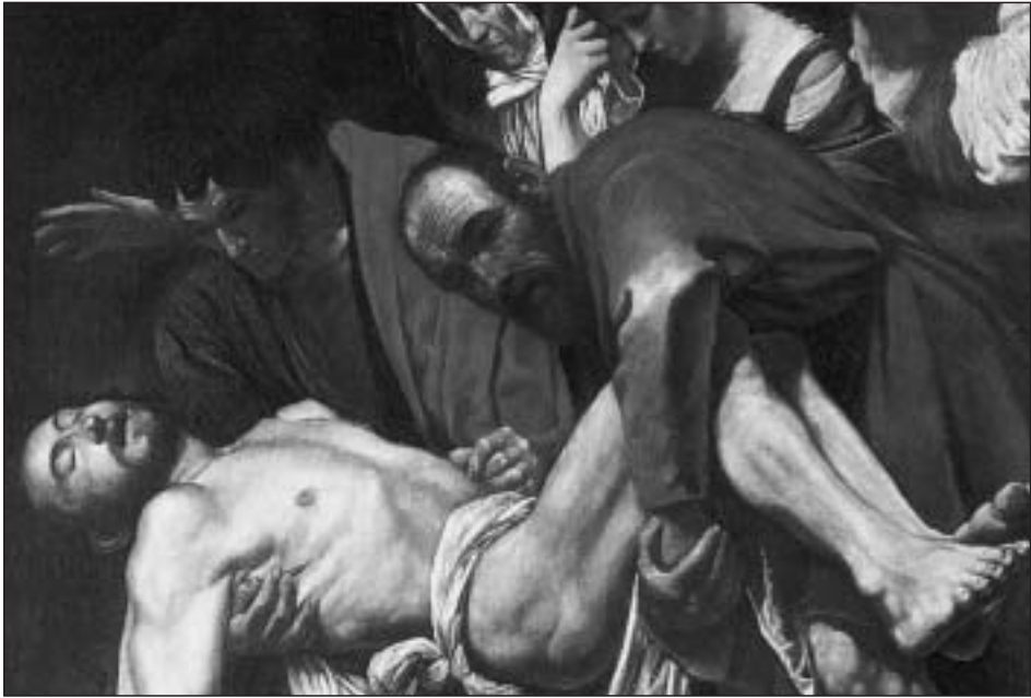
Figura 5. Entierro de Cristo (detalle), copia de Caravaggio, óleo/lienzo, 110x158 cm. Colección particular