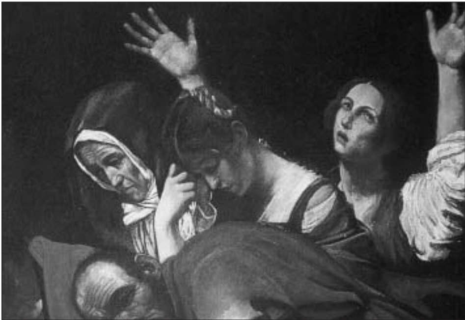
Figura 6. Entierro de Cristo (detalle), copia de Caravaggio, óleo/lienzo, 110x158 cm. Colección particular

Como muestra de lo que es capaz y de su aptitud y excelentes disposiciones para el arte que cultiva Asarta ha enviado a la Diputación de Navarra un cuadro, copia de otro de Miguel Ángel de Caravaggio, que representa el enterramiento del