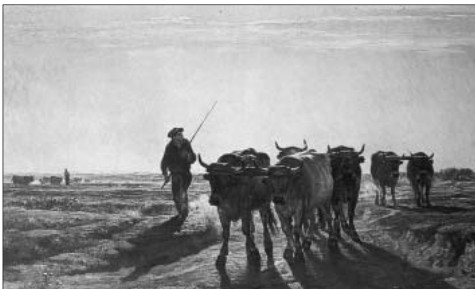
Figura 7. Vuelta del trabajo , óleo/lienzo, 122x149 cm. Museo de Navarra