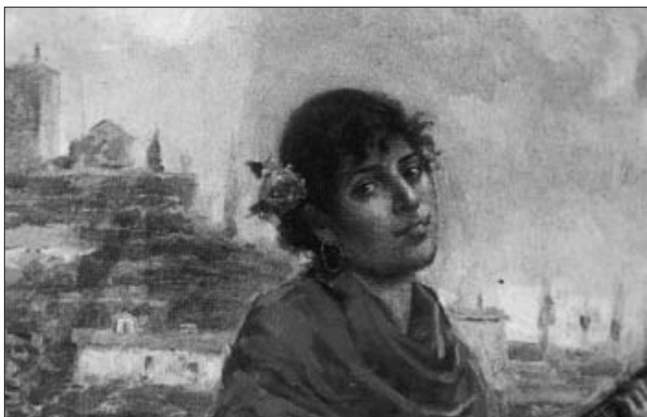
Figura 3. Gitana con guitarra (detalle), óleo/lienzo, 64x52,5 cm. Museo de Navarra